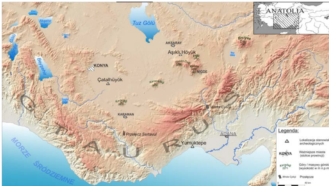
Ryc. 1. Lokalizacja Çatalhöyük i najważniejszych stanowisk archeologicznych w Środkowej Anatolii (oprac. A. Klimowicz)