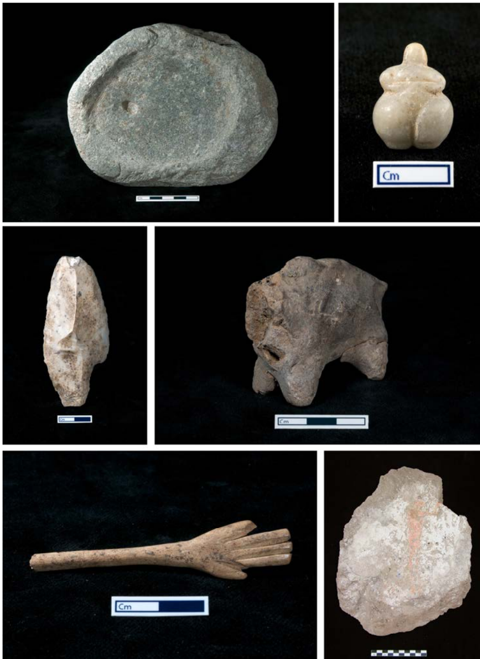
Ryc. 3. Wybór zabytków odkrytych w strefie wykopaliskowej TP