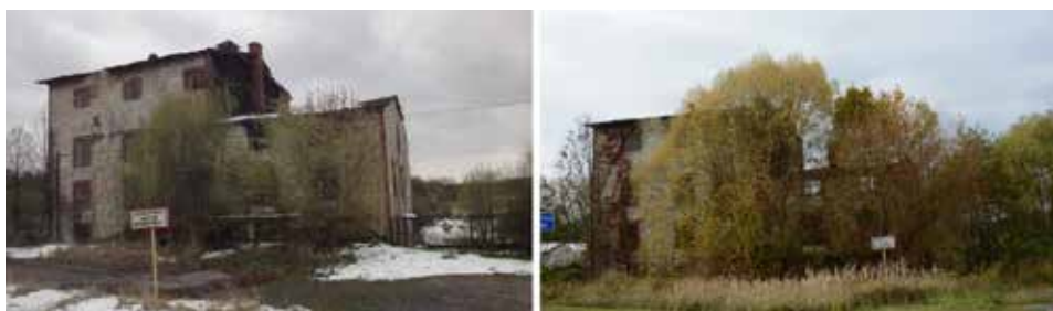
Ryc. 2. Młyn w Kniei (gm. Przyrów). Widok od strony wschodniej w kwietniu 2017 roku i w październiku 2022 roku

Fig. 2. The mill in Knieja (Przyrów commune). An eastern view, in April 2017 and in October 2022