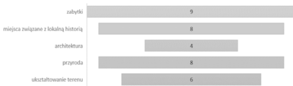
Ryc. 11. Walory krajobrazu Jury Krakowsko-Częstochowskiej

Odrębny blok pytań w kwestionariuszu dotyczył charakterystyki krajobrazu z omawianego obszaru. Jako wartościowe badani przede wszystkim wskazywali elementy związane z historią oraz krajobrazem fizyczno-przyrodniczym. Rozkład odpowiedzi oddaje poniższa rycina.