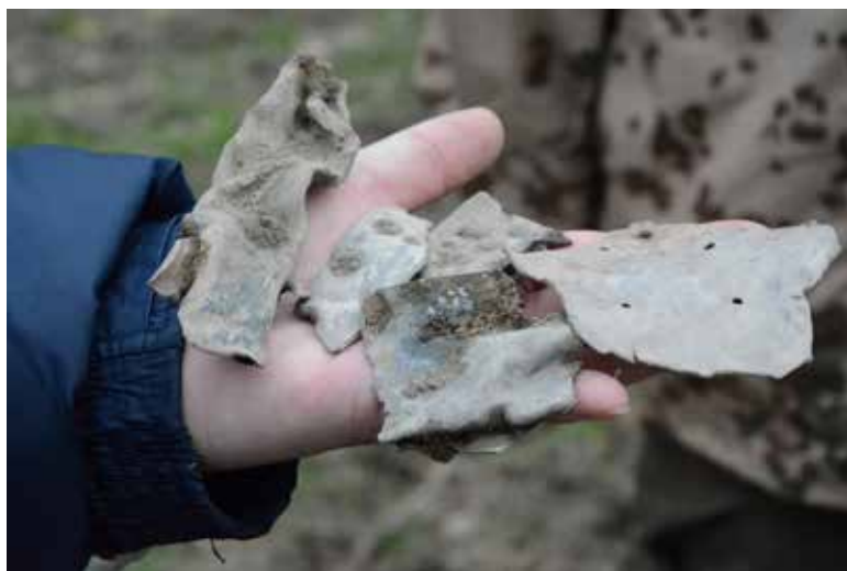
Ryc. 8. Metalowe fragmenty samolotu odkryte na wskazanym przez rozmówców polu we wsi Lgoczanka, w trakcie badań nieinwazyjnych obiektu w listopadzie 2016 roku

usytuowany w pierwotnym miejscu. Nieco gorzej zachowane są rowy strzeleckie, ulegające procesowi niwelacji, szczególnie na terenach użytkowanych przez rolnictwo (Karpińska, Majorek, Rak, Janik, Gadowska, 2016, s. 139–147; Krupa-Ławrynowicz, Ławrynowicz, Rak, Nita, Gadowska, 2019, s. 300–313). Z kolei na terenach leśnych, np. w okolicy Gródka w gm. Lelów, czytelne są one do dziś w krajobrazie (ryc. 8), pełniąc niekiedy funkcję wygodnych leśnych ścieżek (Krupa-Ławrynowicz, Ławrynowicz, Majewska, Nita, Gadowska, 2019, s. 341–344).