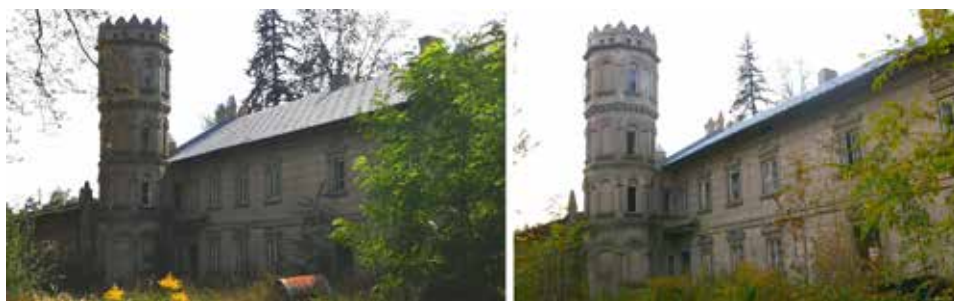
Ryc. 1. Pałac w Kłobukowicach (gm. Mstów). Widok od strony północnej we wrześniu 2014 roku i w październiku 2022 roku