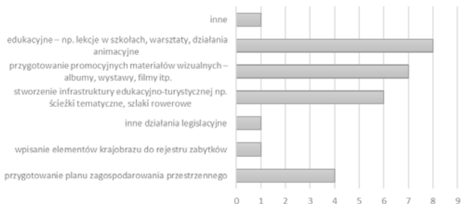
Ryc. 10. Działania, projekty związane z tematyką krajobrau

Odpowiedzi te znajdują potwierdzenie we wskazaniach na pytanie, w którym prosiliśmy o podanie przykładów podejmowanych przez organizacje/instytucje działań na rzecz krajobrazu. Wymienione przede wszystkim te przedsięwzięcia, które związane były z edukacją oraz promocją. Rozkład oddaje poniższa rycina.