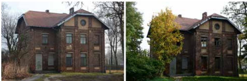
Ryc. 3. Dworzec w Turowie (gm. Olsztyn). Widok od strony zachodniej w grudniu 2015 roku i październiku 2022 roku

Bardziej zaawansowany proces destrukcji i dewastacji widoczny jest w przypadku międzywojennego budynku dawnej szkoły w Zarębicach w gm. Przyrów (Krupa-Ławrynowicz, Ławrynowicz, Majewska, Nita, Gadowska, Cieśliczka, 2019, s. 114–120). Jest to tym bardziej przejmujące, że obiekt ten zbudowany został z datków społecznych.