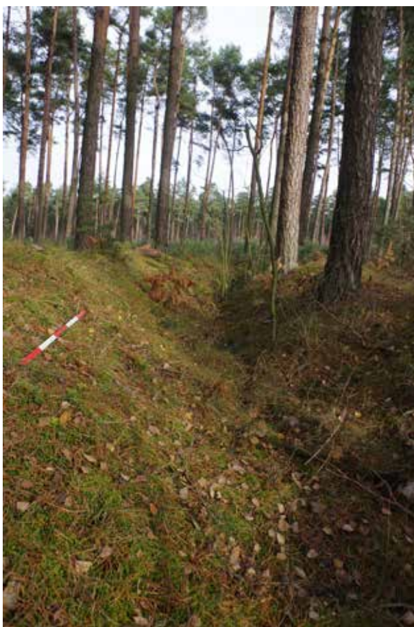
Ryc. 9. Fragment tranzei linii a – 2 niemieckich umocnień z 1944 roku w lesie na wschód od Gródka nad Pilicą w listopadzie 2016 roku