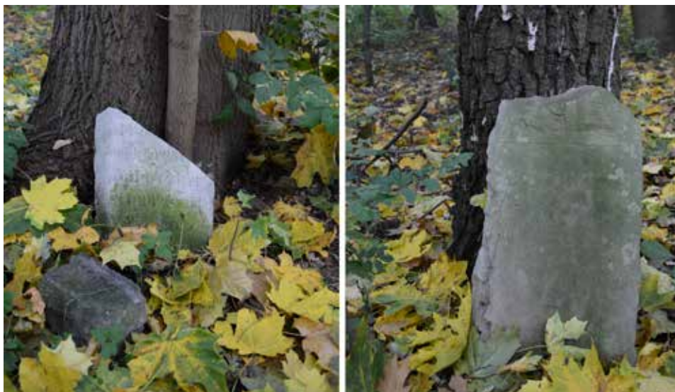
Ryc. 6. Fragmenty macew oparte o drzewa na terenie cmentarza żydowskiego w Przyrówie (gm. loco) w październiku 2022 roku