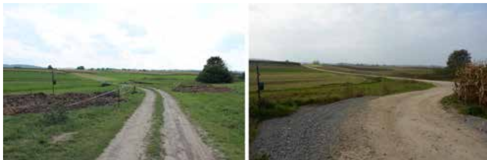
Ryc. 7. Dwa masowe groby niemieckich żołnierzy i cywili, rozstrzelanych w styczniu 1945 roku przez żołnierzy Armii Czerwonej. Widok od strony północno-wschodniej w trakcie badań sondażowych w lipcu 2016 roku oraz w październiku 2022 roku

W przypadku ujawnionych w trakcie projektu jurajskiego grobów ofiar wojennych zbrodni sowieckich narodowości niemieckiej (Konstantynów i Brzozowa Góra w gm. Lelów) i ukraińskiej (Krasice w gm. Mstów), działania komemoratywne, o ile w ogóle się pojawiły, stanowiły oddolną inicjatywę mieszkańców kierujących się tradycją szacunku dla zmarłych, niezależnie o tego, kim byli za życia (Krupa-Ławrynowicz, Ławrynowicz, Rak, Nita, Gadowska, 2019, s. 289–296; Krupa-Ławrynowicz, Ławrynowicz, Majewska, Nita, Gadowska, 2019, s. 305–313). I to jednak się zmienia. Po zweryfikowaniu przy drodze polnej w Brzozowej Górze w gm. Lelów dwóch jam grobowych zawierających szczątki żołnierzy i cywilów narodowości niemieckich, rozstrzelanych w styczniu 1945 roku przez żołnierzy Armii Czerwonej, do dziś nie zostały przeprowadzone w tym miejscu prace ekshumacyjne. Po zmianie przebiegu polnej drogi w ostatnich latach jeden ze zlokalizowanych w 2016 roku grobów masowych znalazł się bezpośrednio pod nią (ryc. 7).