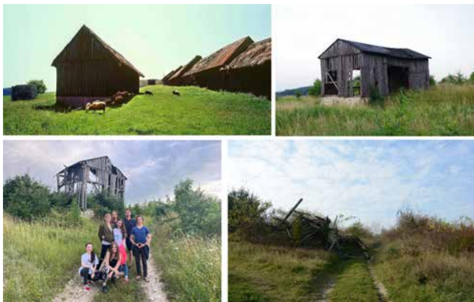
Ryc. 4. Dzielnica stodół w Mstowie (gm. loco). Widok od strony północnej w latach 90. XX wieku; widok od strony zachodniej w lipcu 2013 roku; widok od strony północo-wschodniej w lipcu 2022 roku podczas wycieczki studentów archeologii UŁ i w październiku 2022 roku

Końcowy etap archeologizacji czytelny jest w krajobrazie zabytkowej dzielnicy stodół w Mstowie (Krupa-Ławrynowicz, Ławrynowicz, Rak, Nita, Gadowska, 2019, s. 165–186). Jesienią 2022 roku zawaliła się tam ostatnia wolno stojąca drewniana stodoła (ryc. 4). Zespół zabudowań, który przez dziesięciolecia współtworzył fizyczną tożsamość tej jurajskiej miejscowości, definitywnie odchodzi już do przeszłości. Do kategorii miejsc użyteczności publicznej zaliczony został także prywatny budynek mieszkalny w Hucisku, w którym w czasie II wojny światowej mieściła się radiostacja Armii Krajowej (Karpieńska, Majorek, Janik, Gadowska, 2019, s. 170–173). Obiekt ten jest użytkowany i unowocześniany, nie grozi mu destrukcja.