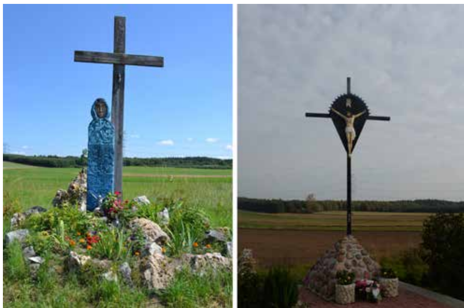
Ryc. 5. Figura Matki Boskiej o twarzy jasnogórskiej Madonny oraz krzyż z wizerunkiem Chrystusa. Widok od strony zachodniej w czerwcu 2016 roku oraz to samo miejsce w październiku 2022 roku

Natomiast figura Madonny z towarzyszącym jej prostym krzyżem, usytuowana na szlaku pielgrzymim w Zawadzie w gm. Mstów, zastąpiona została ozdobnym krzyżem na cokole (ryc. 5), zapewne w wyniku problemów, które wynikły przy renowacji pierwotnej rzeźby (Krupa-Ławrynowicz, Ławrynowicz, Rak, Nita, Gadowska, 2019, s. 225–230). Mimo tak różnych przemian i zamian wspomniane obiekty zachowały swoją pierwotną funkcję religijną.