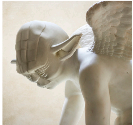
Ryc. 2b. Fotokolaż Trávisa Durdena (1975-), Yodea Angel (2015). Fot. Travis Durden © http://travisdurden.com/index.php/oeuvres [dostęp: 17 sierpnia 2017]

Drugą ze wspomnianych w zacytowanej przed chwilą wypowiedzi Durdena postaci, Mistrza Jedi, artysta utożsamił z cherubinem w wersji klasycystycznej autorstwa francuskiego rzeźbiarza Antoine'a-Denisa Chaudeta ( L'Amour ). Fotokolaż z cherubinem o głowie mistrza Jedi otrzymał nazwę Yodea Angel .