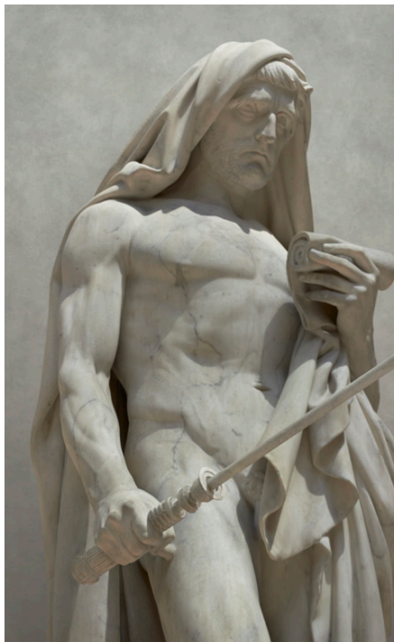
Ryc. 6b. Fotokolaz Trávisa Durdena (1975-), Marble Saber (2015). Fot. Travis Durden © http://travisdurden.com/index.php/oeuvres [dostęp: 17 sierpnia 2017]

Ryc. 6a. Jean-Baptiste Roman (1792-1835), François Rude (1784-1855), Caton d'Utique lisant le Phédon avant de se donner la mort (1840). Marmur. Musée du Louvre. Fot. Jąstrow © Wikimedia Commons.