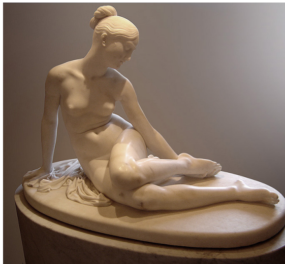
Ryc. 7a. Lorenzo Bartolini (1777-1850), Ninfa dello Scorpione (1845). Marmur. Musée du Louvre.