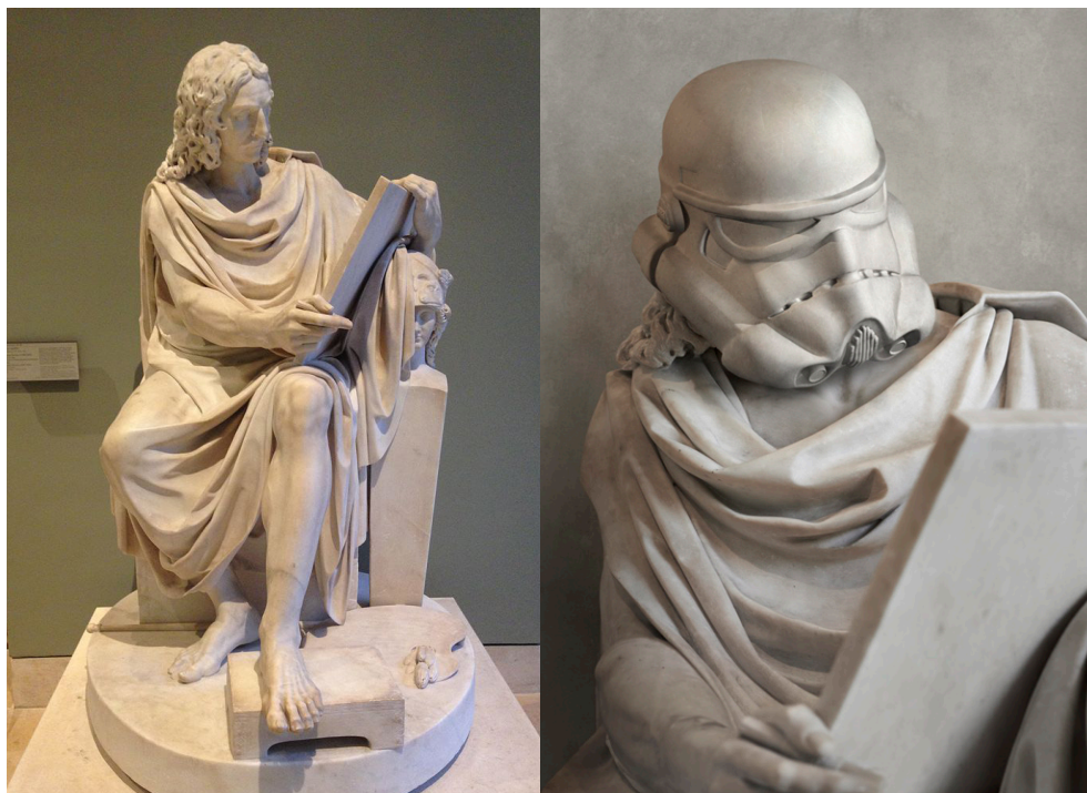
Ryc. 9a. Pierre Julien (1731-1804), Nicolas Poussin (1822). Marmur. Musée du Louvre.