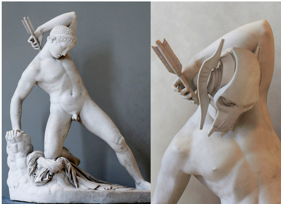
Ryc. 5a. James Pradier (1790-1852), Niobide blessé (1822). Marmur. Musée du Louvre.