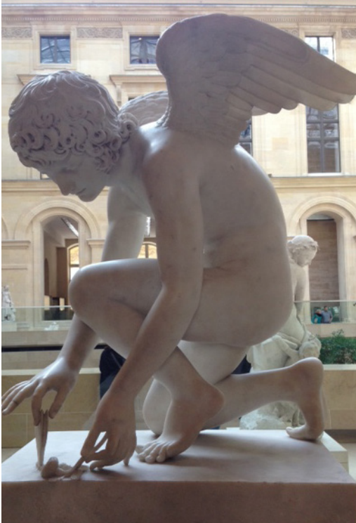
Ryc. 2a. Antoine-Denis Chaudet (1763-1810), L'Amour (1802). Marmur. Musée du Louvre.

I also imagined Darth Vader as a great sage, returning among the living. [...] My favorite character is Darth Vader, a nice Jedi who became a villain to save his beloved wife Padmé Amidala 14 .