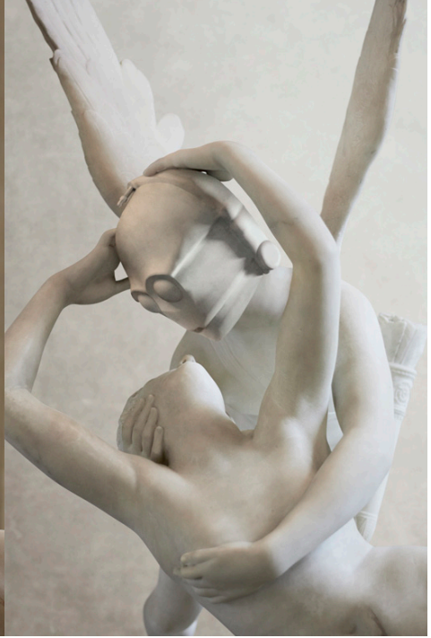
Ryc. 4b. Fotokolaz Trvisa Durdena (1975-), Love Droid (2015). Fot. Travis Durden © http://trvisdurden.com/index.php/oeuvres [dostęp: 17 sierpnia 2017]

Jedną z najsłynniejszych rzeźb klasycystycznych, Psyché ranimée par le baiser de l'Amour (1786-1793) autorstwa Antonia Canovy, stała się natomiast bazą do przedstawienia nowej wersji jednej z najważniejszych postaci uniwersum Gwiezdných wojen , robota protokolarnego z planety Tatooine – C3PO, skonstruowanego przez młodego Anakina Skywalkera. Nowe, zaskakujące wcielenie droida, który zyskał miano Love Droid , zostało zinterpretowane przez twórcę w następujących słowach: