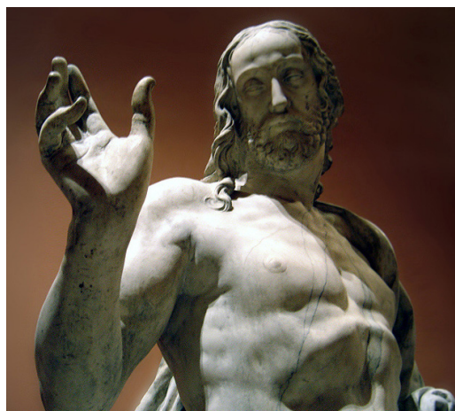
Ryc. 1a. Germain Pilon (ok. 1537-1590), fragment grupy rzeźbiarskiej pt. La Résurrection (ok. 1572). Marmur. Musée du Louvre.

Much like the figures from ancient legends, the characters in ‘Star Wars’ have a dimension of heroes and villains, and crystallize what is best and worst in human nature. In that sense, they perfectly fit together 13 .