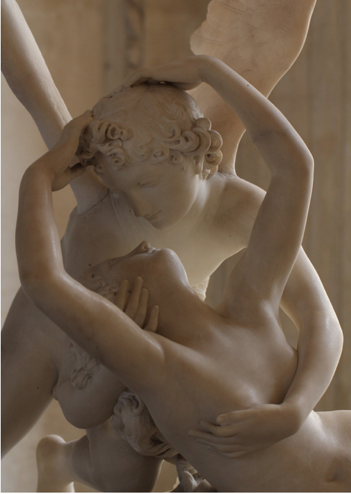
Ryc. 4a. Antonio Canova (1757-1822), Psyché ranimée par le baiser de l'Amour (1786-1793). Marmur. Musée du Louvre.