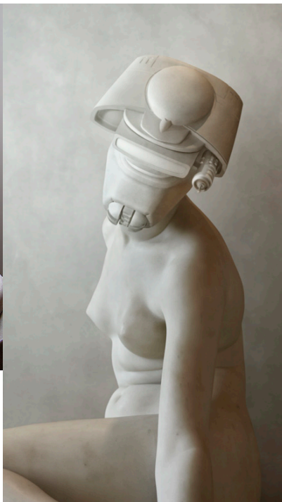
Ryc. 7b. Fotokolaż Trvisa Durdena (1975-), The Nymph, bounty hunter (2015). Fot. Travis Durden © http://trvisdurden.com/index.php/oeuvres [dostęp: 17 sierpnia 2017]

The Nymph, bounty hunter to z kolei nazwa innej propozycji fotografa francuskiego, powstałej z inspiracji rzeźbą neoklasycystyczną autorstwa Lorenza Bartoliniego pt. Ninfa dello Scorpione (1845). Bounty Hunter to bohater gry wideo ( Star Wars: Bounty Hunter ) wyprodukowanej w 2002 roku w amerykańskiej LucasArts Entertainment Company (LLC) 18 dla GameCube i PlayStation 2.