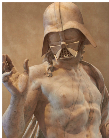
Ryc. 1b. Fotokolaż Trvisa Durdena (1975-), Darth's Résurrection (2015).

Przyjrzyjmy się wszystkim dziewięciu fotokolażom i rzeźbom z Luwru, które Durden wybrał do swojego projektu. Najbardziej szokujące zestawienie prezentuje fotokolaż pt. Darth's Résurrection . Wyobrażenie głowy Dartha Vadera zostało połączone z ciałem Jezusa z rzeźby francuskiego rzeźbiarza renesansowego Germaina Pilon, stanowiącej część grupy La Résurrection (ok. 1572). Artysta skomentował tę kompozycję w następujących słowach: