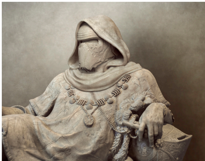
Ryc. 8b. Fotokolaż Trvisa Durdena (1975-), Amiral de Ren (2015).

Fotokolaż zatytułowany Amiral de Ren powstał z cyfrowego przekształcenia fragmentu rzeźby z grobu Philippe'a Chabota (1480–1543), znanego jako Admiral De Brion , admirała Francji z XVI wieku.