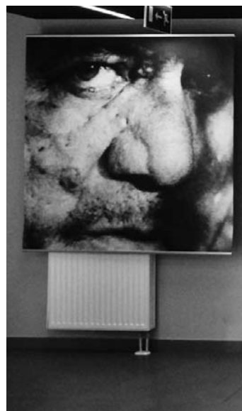
Fotografie wielkoformatowe 150 x 150 cm