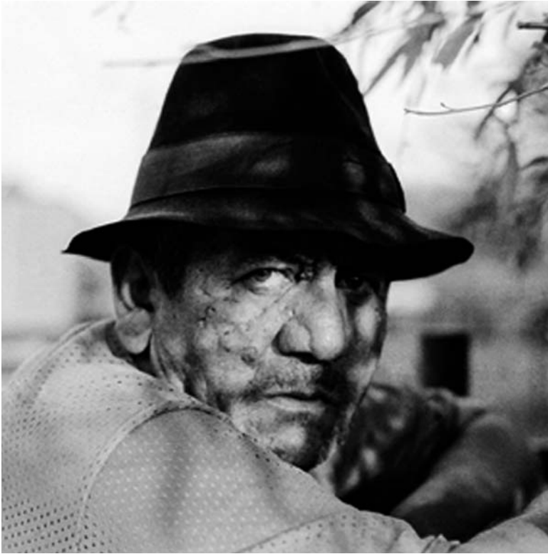
Fotografia analogowa, 50 x 50 cm