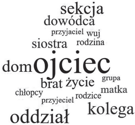
Rysunek 1. Figury pamięci