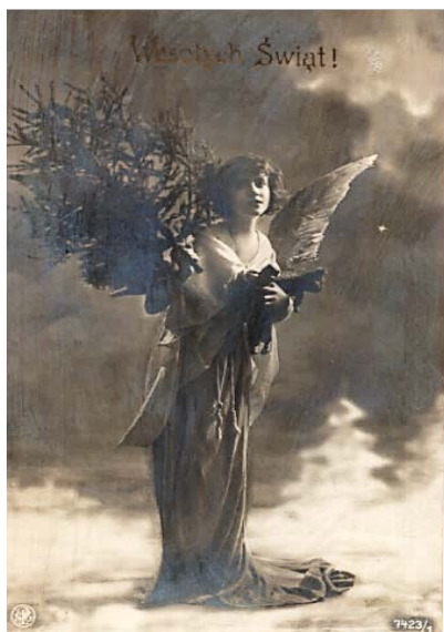
Ryc. 13. Kobieta w przebraniu anioła niosąca choinkę i zabawki dla dzieci, pocztówka, początek XX wieku