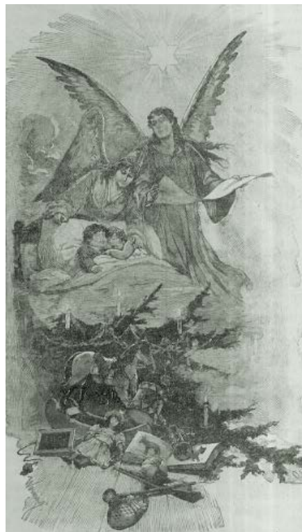
Ryc. 2. Sen dzieci

Jak ptaszęta wpośród gniazdka Śpią dziateczki śpią I prześlicznie śnią: O lalczeczce i koniku, O książeczeczce i biczyku, O chojence ze świeczkami, Z rumianem i jabłuszkami, Śnią dziateczki śnią I cichutko śpią. A na niebie świeci gwiazdka, Śpiewa Anioł Stróż: Bóg się zrodził już! 31