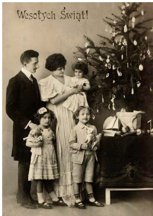
Ryc. 10. Rodzina przy choince, kartka pocztowa, początek XX wieku

Na pocztówce datowanej na początek XX wieku (ryc. 10) widzimy pięcioosobową rodzinę przy choince, gdzie każde dziecko trzyma w rączkach zabawkę. Dziewczynka przytula niewielką, długowłosą lalkę ubraną w jasną sukienkę, chłopiec trzyma wełnianą owieczkę, prawdopodobnie wypchaną, z naturalnej owczej wełny. Trudno zidentyfikować zabawkę trzymaną przez najmłodsze dziecko; być może jest to jakaś grzechotka lub niewielka figurka. Pod choinką znajduje się piękna żaglówka, którą można było puszcząć na wodzie.