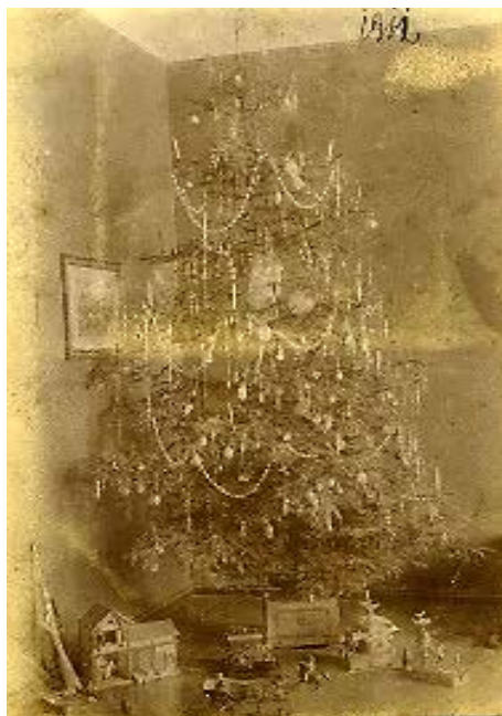
Ryc. 15. Choinka , 1911 rok