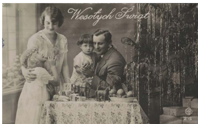
Ryc. 11. Rodzina przy choince i stoliku z zabawkami, kartka pocztowa, 1916 rok

Na innej pocztówce (ryc. 11), datowanej na 1916 rok, świąteczne upominki i łakocie zostały wyeksponowane na specjalnym stoliku, przy którym obok choinki zgromadziła się rodzina. Wśród zabawek, które dzieci znalazły pod choinką, widzimy wózek dzwonekowy zaprzężony w dużego psa powleczonego sierścią (dzwonek znajdował się pomiędzy dużymi kołami zaprzęgu, kiedy dziecko wprowadzało zabawkę w ruch, symulując ciągnięcie zaprzęgu przez psa, dzwonek wydawał dźwięk), klocki z literami i obrazkami (różnej wielkości klocki pozwalały ustawić z nich wieżę – od największego do najmniejszego), figurkę konika (prawdopodobnie odlaną z celulozoidu), pluszowego misia, pluszowego kota na platformie z kółkami, laleczkę niemowlę, małą drewnianą figurkę owieczki na platformie. Dziewczynka przykłada jakiś przedmiot do ust – być może jest to gwizdek. Ułożenie zabawek zaprezentowane na pocztówce może sugerować, które z nich były przeznaczone dla dziewczynki, a które dla chłopca.