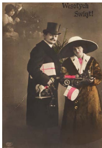
Ryc. 12. Z podarkami, pocztówka, po roku 1900

Częstym motywem prezentowanym na kartkach świątecznych była