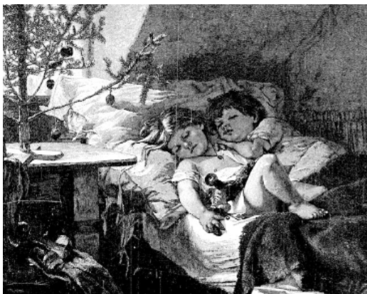
Ryc. 8. Poranek Bożego Narodzenia

Podobnie na rycinie 9 widzimy śpiące dzieci, które znużone wrażeniami wigilijnego wieczoru i zabawą wyczekiwanyymi zabawkami zasnęły w ich otoczeniu.