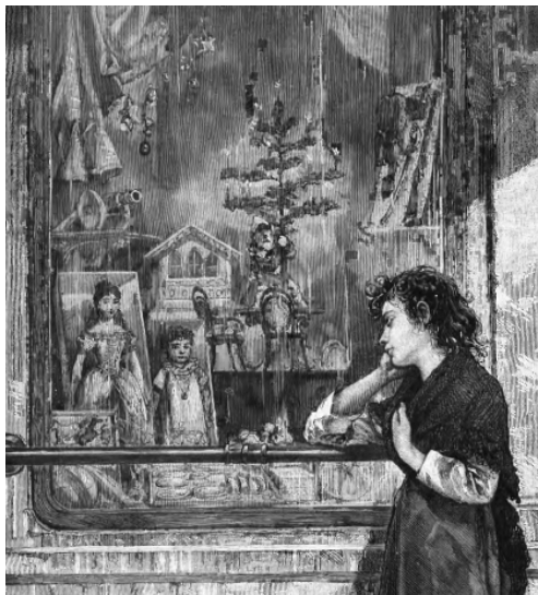
Ryc. 1. „Nie dla mnie...”, rysunek oryginalny Ksawerego Pillatiego (fragment grafiki)

Zapewne taką dziewczynkę uwiecznił K. Pillati. Biedna, bosa, z podpartą na ręce głową, tęsknym wzrokiem wpatruje się w pięknie ubrane, kosztowne lalki. Oprócz nich na wystawie, w towarzystwie figurki Gwiazdora niosącego ustrojoną dziecinną choinkę, znajdują się między innymi: koniki, armata, domek, mebelki (krzesła i stolik) oraz serwis dla lalek – należące do kanonu najpopularniejszych zabawek badanego okresu.