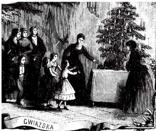
Ryc. 3. Gwiazdka (fragment grafiki)

ka odprawiana w drewnianym kościółku (u góry), szopka (po lewej), pokłon Trzech Króli (po prawej), a na dole grafiki wieczerza wigilijna (po lewej) oraz choinka (po prawej). Na tym właśnie fragmencie została uchwycona chwila, na którą w święta Bożego Narodzenia czekają wszystkie dzieci – wręczenie prezentów. Autor nie wyeksponował zabawek (pod choinką wyraźnie widać jednak różne, choć trudne do rozpoznania, przedmioty przeznaczone dla dzieci), ale ukazał dziecięce emocje towarzyszące oczekiwaniu na podarki – wyciągnięte w górę ręce świadczą o radości i zniecierpliwieniu. Trzy dziewczynki stojące najbliżej choinki zostały przedstawione w momencie podchodzenia po prezenty wręczane przez stojące przy stole kobiety. Za nimi wbiega chłopczyk z podniesionymi do góry rękoma, jakby bał się, że spóźni się i upominków nie otrzyma.