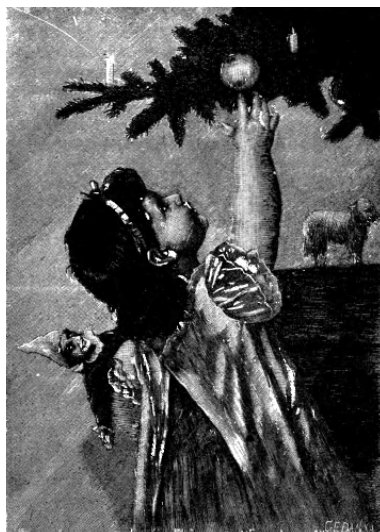
Ryc. 6. Dziewczynka pod choinką sięgająca po jabłko, „Bozia dała”

Przyglądając się poszczególnym postaciom, w lewym górnym narożniku widzimy anioła szyjącego ubranka dla leżącej na stoliku małej laleczki, przed aniołem siedzącym pod ośnieżoną choinką stoi stolik pełen figurek żołnierzy, kominiarczyków i postaci gwiazdora z choinką. Anioł przebrany za doręczycy-