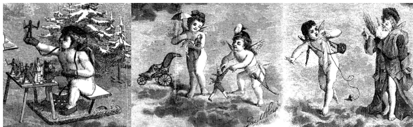
Ryc. 7. Choinka