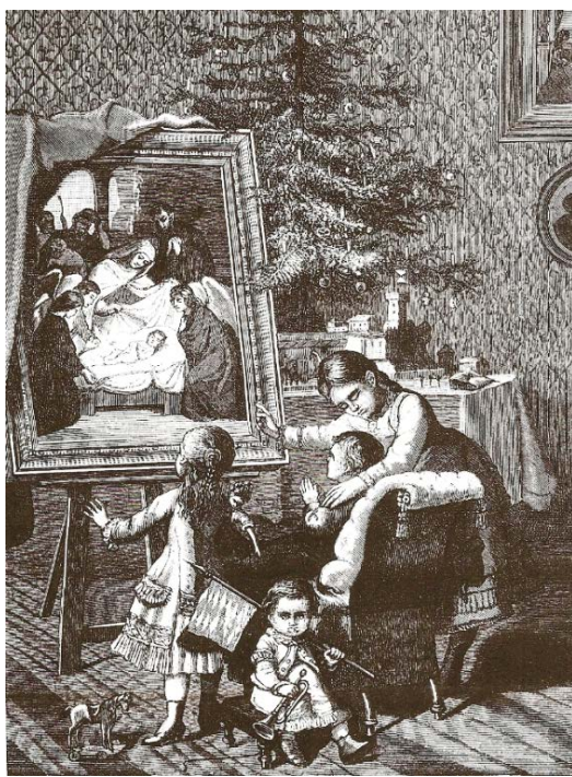
Ryc. 5. Gwiazdka