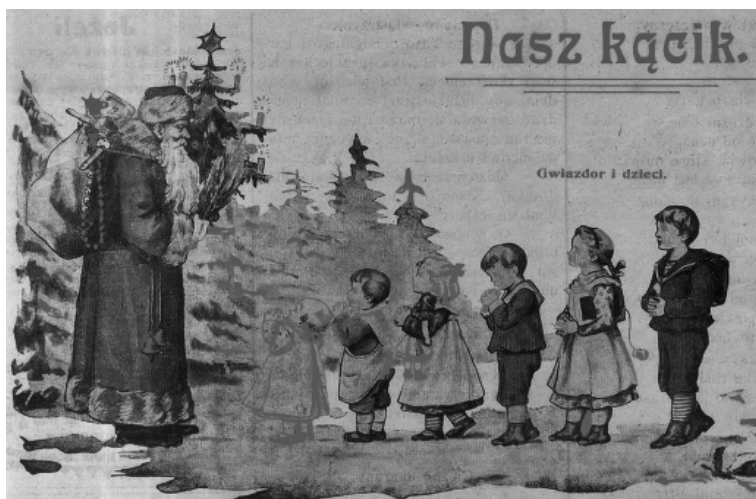
Ryc. 4. Gwiazdor i dzieci

„Ojcie nasz, Zdrowaś i Wierzę”, Drżącym głosem i nieśmiało, Ale serdecznie i szczerze, Płynie z miłością nie małą. Na czele idzie malutka, Najmłodsza z gromadki dzieci: „Gwiazdorku, grzeczna Helutka, Daj tę choinkę co świeci! „Gwiazdorku, różgi nie trzeba!” Jaś mały, Stasia i Józio, Tak proszą wysłańca z nieba, Z wystraszoną nieco buzią. „Ulżyj twym barkom, Gwiazdorku!” Tak Zosia i Zbyszek proszą, Pokaż, co masz tam w tym worku, Co będzie naszą rozkoszą?” Lecz Gwiazdor stary, rzecz znana, Wprzód długie prawi morały, Więc słów tych dziatwo kochana Oj, słuchaj z duszy twej całej!” 33 .