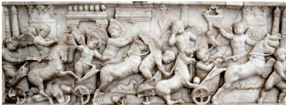
Il. 3a. Sarkofag z wyścigiem erotów, II w., płyta główna, fot. A.A.K.