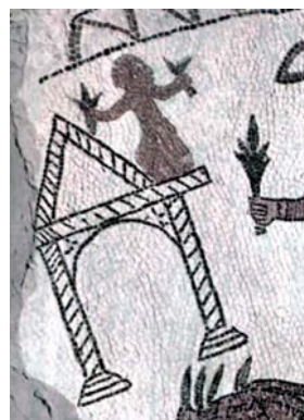
II. 5. Mozaika z Gafsa, VI w., fragmenty [online].