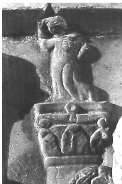
Il. 3c. Sarkofag z wyścigiem erotów, II w., detal, za: F. Marcattili, Circo Massimo. Architetture, funzioni, culti, ideologia, Roma 2009, fig. 73