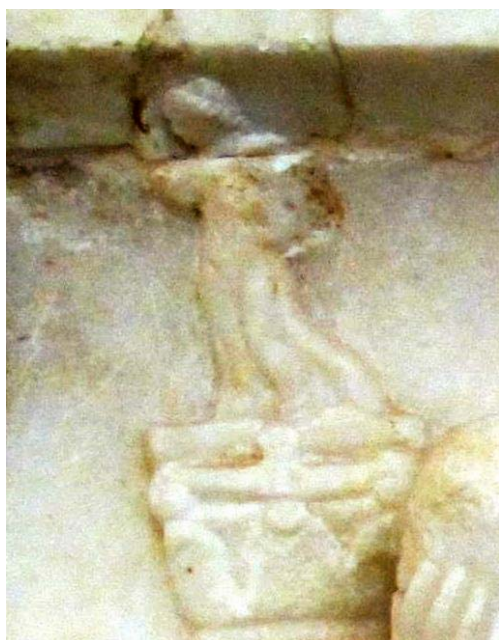
Il. 3b. Sarkofag z wyścigiem erotów, II w., detal