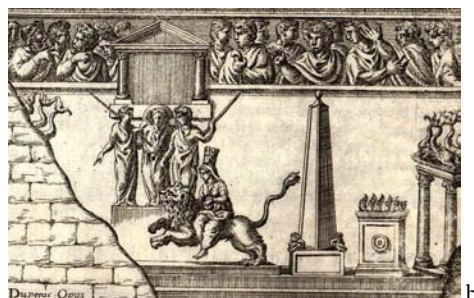
II. 6. Relief Maffei, IV w.?, fragmenty ryc., za: a. G. Rodenwaldt, Römische Reliefs. Vorstufen zur Spätantike, Jahrbuch des Deutschen Archäologischen Instituts. Archäologischer Anzeiger 55, 1940, Abb. 10; b. Onuphrii Panvini Veronensis, De ludis circensibus libri II, Venetiis 1600