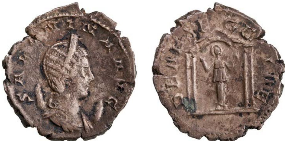
Il. 1. Walerian (253-260) i Gallien (253-268), antoninianus , Kolonia, 258-260, RIC 5,1, Salonina, JR of Gall., nr 5, Aw.: SALONINA AVG, popiersie cesarzowej w prawo; Rw.: DEAE SEGETIAE, świątynia i stojąca bogini [online]. Numismatics [dostęp: 2016-05-12]. Dostępny w Internecie: < http://numismatics.org/collection/1944.100.30661 >