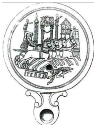
II. 4. Lampka oliwna, 30-70 n.e., ryc., za: J.H. Humphrey, Roman Circuses. Arenas for Chariot Racing, London 1986, fig. 88