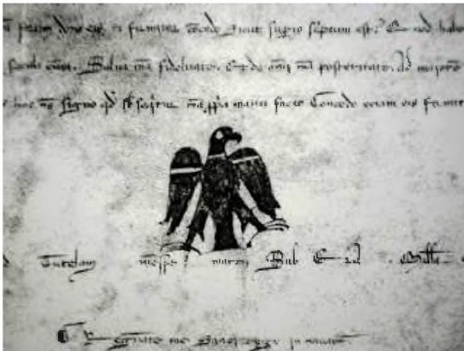
Fuente: Los más antiguos datan de 1196 y 1214 y se encuentran respectivamente en el Archivo de la Seo de Zaragoza y en el Archivo Municipal de Pamplona