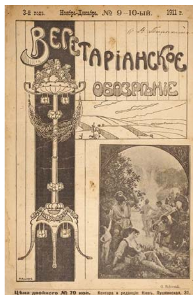
Fot. 5. Przegląd Wegetariański, 1911 r.