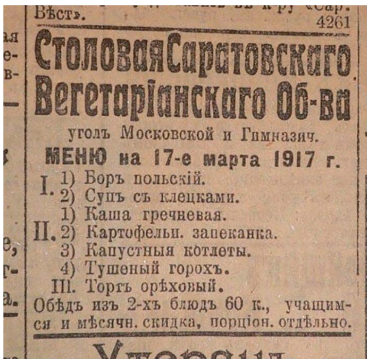
Fot. 8. Wegetariańskie menu w jednej z moskiewskich stołówek, 1917