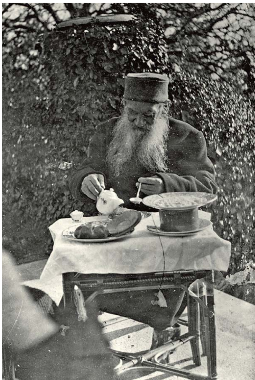
Fot. 1. Lew Tołstoj przy śniadaniu, 1901 r.