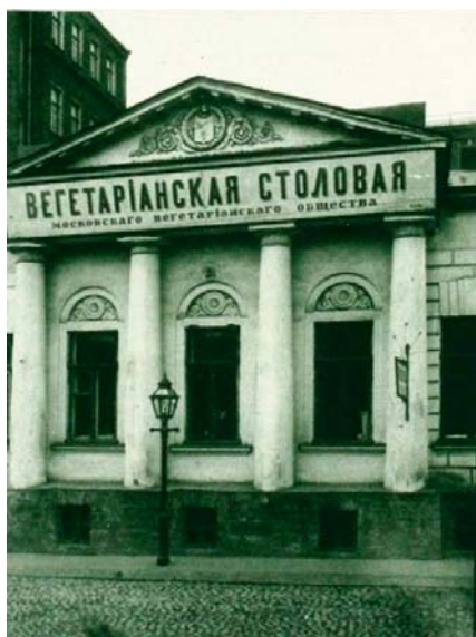
Fot. 7. Stołówka wegetariańska w Moskwie przy bulwarze Nikitskim