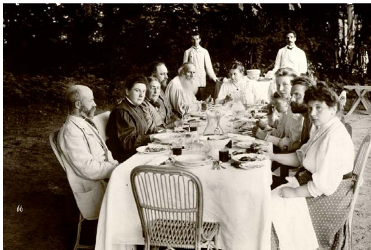
Fot. 2. Lew Tołstoj z rodziną i bliskimi podczas obiadu w Jasnej Polanie, 1908 r.