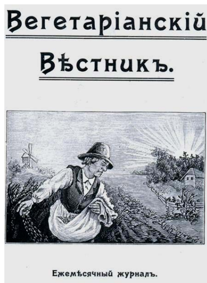
Fot. 6. Goniec Wegetariański, 1904 r.