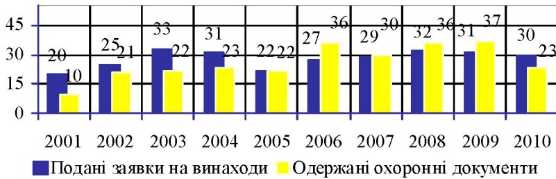
Рис. 3. Динаміка показників винахідницької діяльності ДНУ ім. О. Гончара [11]

ним питання щодо того, якою має бути структура некомерційних форм трансферу технологій з позиції визначення їх ефективності та впливу на інноваційний розвиток саме нашої економіки. Адже загальновідомим є те, що багато наукових розробок та пропозицій так і залишаються невикористаними в Україні. Ми вважаємо, що ця проблема є не лише проблемою інноваційного менеджменту університету.