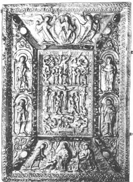
8. Oprawa ze złota i kości słoniowej fundacji opatki Thephanu, Skarbiec katedry w Essen (według H. Jantzen, Ottonische Kunst , München 1947).