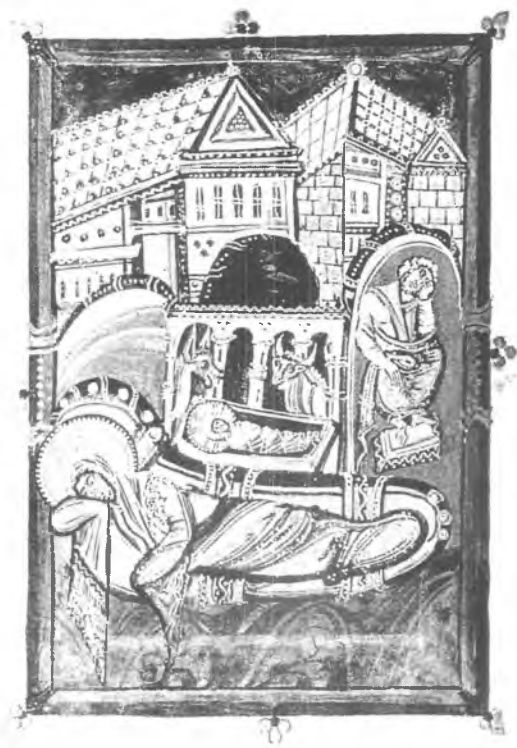
6. Boże Narodzenie, miniatura z Ewangeliarza opatki Nitdy z Meschede, ok. 1020 r. (według P. Bloch, H. Schnitzler, Die Ottonische Kölner Malerschule , Bd I, Düsseldorf)