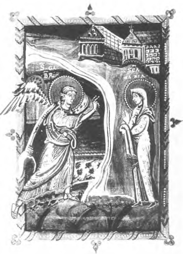
4. Zwiastowanie, miniatura z Ewangeliarza opatki Nitdy z Meschede, ok. 1020 r. (według P. Bloch, H. Schnitzler, Die Ottonische Kölner Malerschule , Bd I, Düsseldorf 1967).