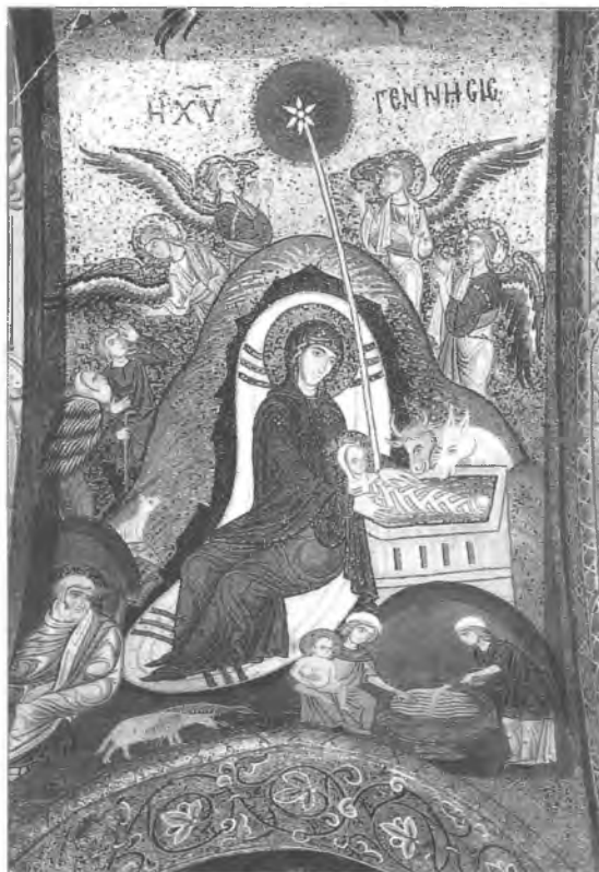
7. Boże Narodzenie, mozaika w kościele Mar-torana w Palermo, XII w. (według O. Demus, The Mosaics of Norman Sicily , London 1949).