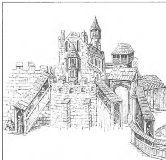
4. Mistrz tryptyku św. Stanisława z kościoła Mariackiego w Krakowie, fragment kwatery Męczeństwo św. Stanisława , pocz. XVI w. (przerys według Firlet 1998).