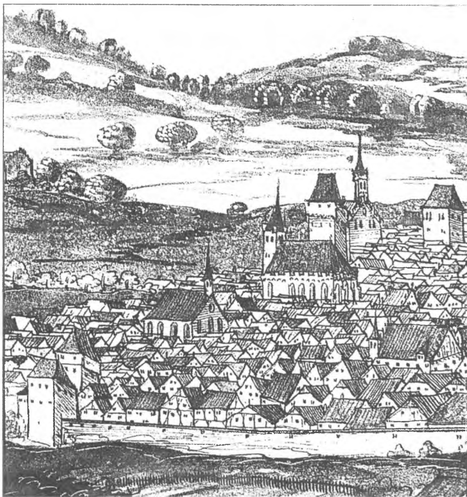
6. Widok zachodniej części miasta Kazimierza, fragment anonimowego widoku Krakowa, ok. 1536–1537 (według Firlet 1998).