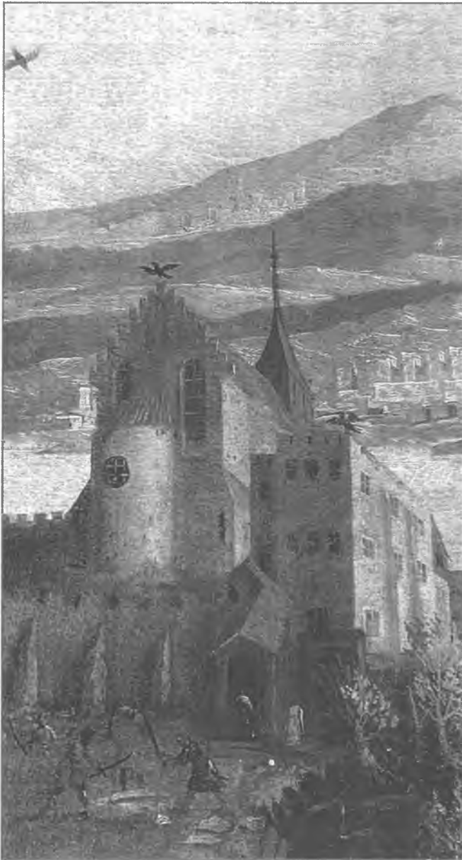
9. Br. Izidor Leszczyński, fragment obrazu ołtarzowego ze sceną męczeństwa św. Stanisława z jasnogórskiego klasztoru paulinów, 1627 (według Dziedzic 1999).