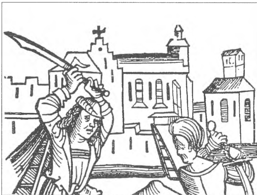
2. Męczeństwo św. Stanisława , fragment drzeworytu z Computus novus totius fere astronomiae , Kraków 1504 (według Dziejnic 1999).