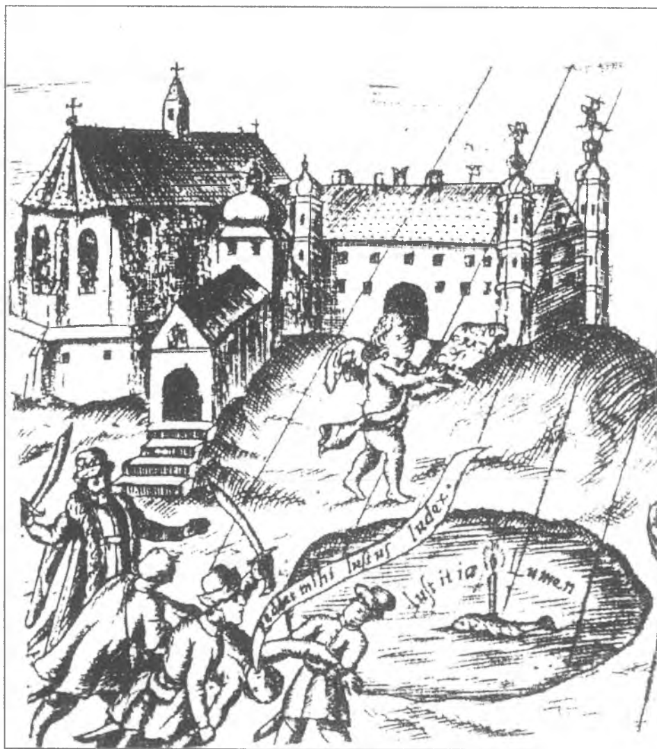
10. Męczeństwo św. Stanisława, fragment miedziorytu z O. Rafal Michalski, Diva aequitatis bilanx... , 1673 (według Dziedzic 1999).