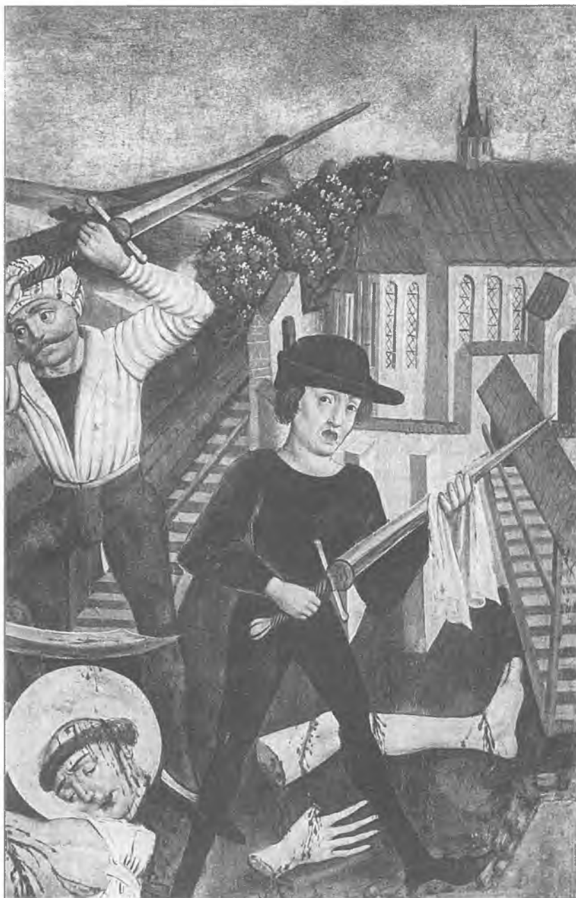
1. Mistrz tryptyku ze Starego Bielska, fragment kwatery Męczeństwo św. Stanisława , przed r. 1500 (według Walicki 1961).