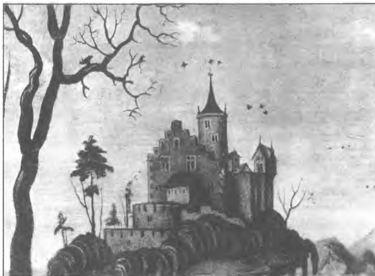
5. Krakowski naśladowca Cranacha, fragment obrazu Madonna z Dzieciątkiem z kazimierskiego klasztoru Kanoników Regularnych, ok. r. 1530 (według Walicki 1961).