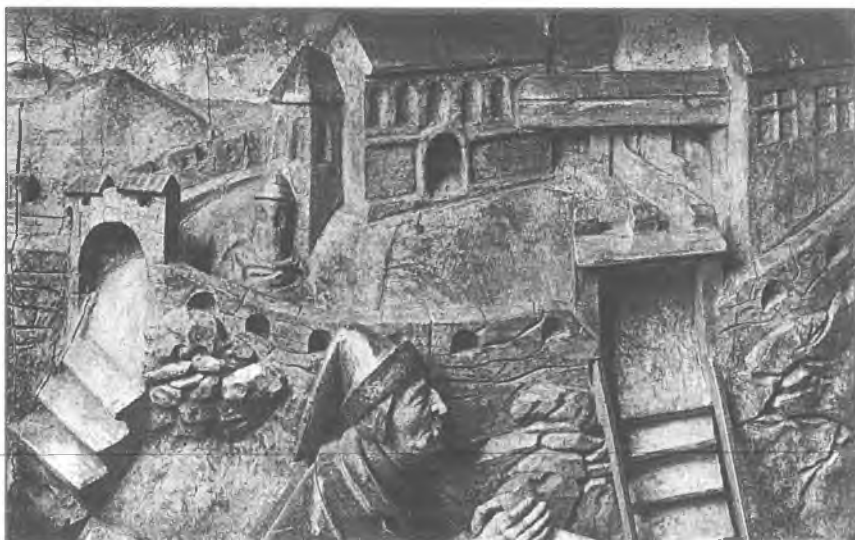
3. Mistrz tryptyku z Pławna, fragment kwatery Męczeństwo św. Stanisława , ok. 1514–1518 (według Dobrzeńiecki 1954).