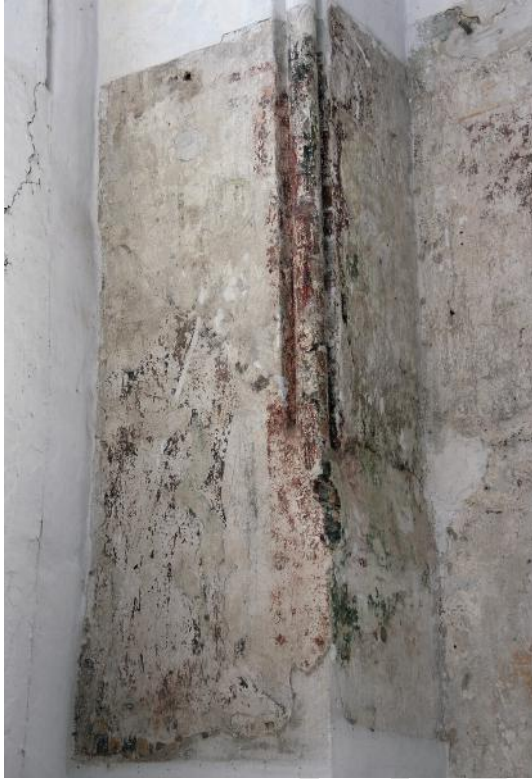
Il. 5. Kościół NMP w Gdańsku, kaplica św. Bartłomieja/Jadwigi, malowidło w południowym ościeżu arkady okiennej, fot. Alicja Grabowska-Lysenko

Kolejne zachowały się jedynie szczątkowo. Na prawo od Ukrzyżowania widnieje koronowana postać, prawdopodobnie św. Katarzyna 9 , pendant przedstawienia św. Małgorzaty ze strony północnej stanowi wizerunek niemożliwej do zidentyfikowania, ukoronowanej świętej. Stan zachowania malowidła w ościeżu arkady okiennej po stronie południowej jest tylko odrobinę lepszy niż przeciwległego: dzięki zachowanym zarysom pastorału z wyraźnie widoczną krzywaśnią, wyobrażoną postać można interpretować jako św. biskupa lub opata/opatkę (il. 5).