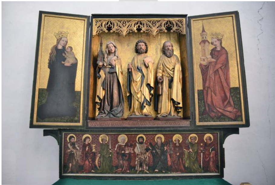
Il. 7. Kościół NMP w Gdańsku, kaplica św. Bartłomieja/Jadwigi, otwarte retabulum ołtarzowe

nieokreślonego świętego z księgą w oprawie sakwowej (brak atrybutu w drugiej dłoni), odzianego w strój z elementami aktualnej mody (obszerny płaszcz spięty na prawym ramieniu) i tunikę przepasaną szerokim pasem, do którego przytroczone są dwa futerały: na nóż oraz na okulary. Interpretacja tych szczegółów ubioru jako stroju „podróżnego” skłaniała dotychczasowych badaczy do identyfikowania tej postaci jako św. Jakuba Starszego 17 . Na awersie lewego skrzydła znajduje się malowany wizerunek Madonny z Dzieciątkiem, na prawym zaś – św. Barbary. Na malowanej predelli przedstawieni zostali święci – centralne miejsce zajmuje św. Bartłomiej ukazany en face , pozostałe postacie zwracają się w jego stronę. Z lewej strony wyobrażono: św. Jana Chrzyciela, św. Jana Ewangelistę, św. Katarzynę oraz, stojącą najbliżej Bartłomieja, św. Jadwigę. Grupę świętych wyobrażonych po prawej stronie otwiera św. Andrzej, a towarzyszą mu św. św. Barbara, Piotr i Paweł.