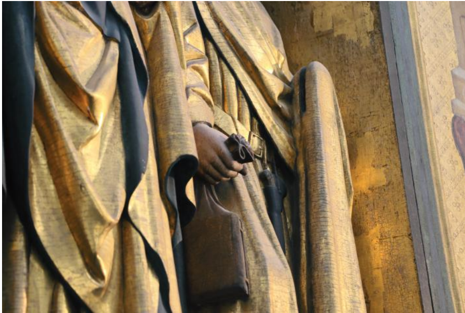
Il. 11. Kościół NMP w Gdańsku, kaplica św. Bartłomieja/Jadwigi, retabulum, fragment postaci nieznanego świętego (św. Andrzeja?)

kłady dzieł, w których krzyż traci swą naturalną wielkość i, sprowadzony tylko do roli symbolu, podtrzymywany jest przez Apostoła jedną ręką (il. 10) 111 . Być może właśnie taka redakcja ikonograficzna została zastosowana w gdańskim retabulum, ponieważ była korzystniejsza punktu widzenia kompozycji dzieła: umożliwiła ona ograniczenie wolumenu figury, co bez wątplenia miało istotne znaczenie przy niewielkiej szerokości korpusu nastawy. Pierwotnemu podtrzymywaniu przez świętego przez poję płaszcza niewielkich rozmiarów krzyża nie przeczy forma ukształtowanej przez snycerza głębokiej, ale wąskiej szczeliny na wysokości dłoni, służącej dawniej osadzeniu atrybutu (il. 11).