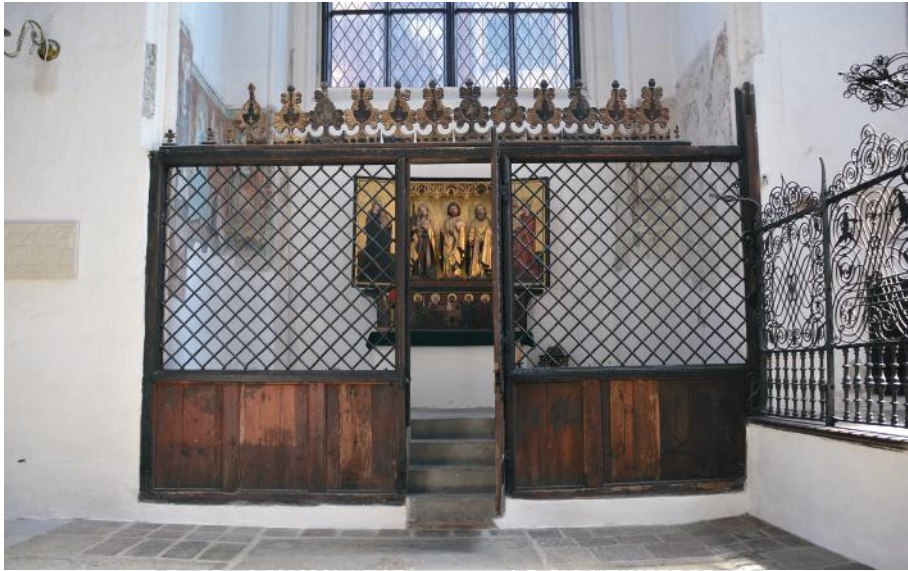
Il. 1. Kościół NMP w Gdańsku, kaplica św. Bartłomieja/Jadwigi, fot. Tomasz Kowalski

We wschodniej części prezbiterium Bazyliki Wniebowzięcia Najświętszej Maryi Panny w Gdańsku, za ołtarzem głównym, znajdują się dwie przestrzenie architektoniczne: szeroka, umiejscowiona na wzdłużnej osi kościoła, oraz – na prawo od niej – węższa, którą od obejścia chóru oddziela ażurowa przegroda. Pierwsza kaplica pozbawiona jest dziś wyposażenia, druga zaś mieści średniowieczną nastawę ołtarzową oraz gotyckie malowidła ściennie (il. 1).