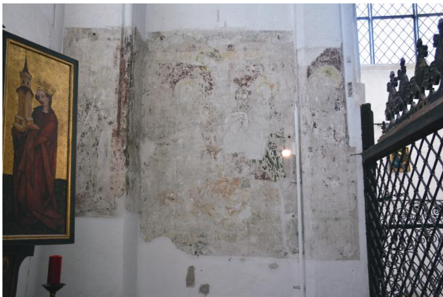
Il. 4. Kościół NMP w Gdańsku, kaplica św. Bartłomieja/Jadwigi, malowidło po stronie południowej

Malowidła zdobią północną i południową ścianę kaplicy. Po ich odkryciu w 1988 r. zdecydowano się na restaurację przedstawień na ścianie północnej, podczas gdy dekorację figuralną ściany południowej poddano jedynie zachowawczej konserwacji 7 . Na ścianie północnej przedstawiono tronującą Madonnę z Dzieciątkiem, otoczoną przez postaci muzykujących aniołów unoszących się