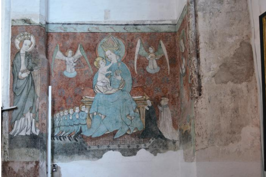
Il. 3. Kościół NMP w Gdańsku, kaplica św. Bartłomieja/Jadwigi, malowidło po stronie północnej, fot. Tomasz Kowalski

Grobu Świętego, wskutek czego powstała jednorodna przestrzeń, określana od-tąd wezwaniem św. Gertrudy. Śladem, który pozostał po pierwotnym podzia-le, było jeszcze w połowie XIX w. dwoje drzwi prowadzących do jej wnętrza 3 . Przestrzeń sąsiadującą od południa z kaplicą św. Bartłomieja miała zajmować kaplica św. Jadwigi (il. 2c), której czas fundacji nie był Th. Hirschowi znany 4 .