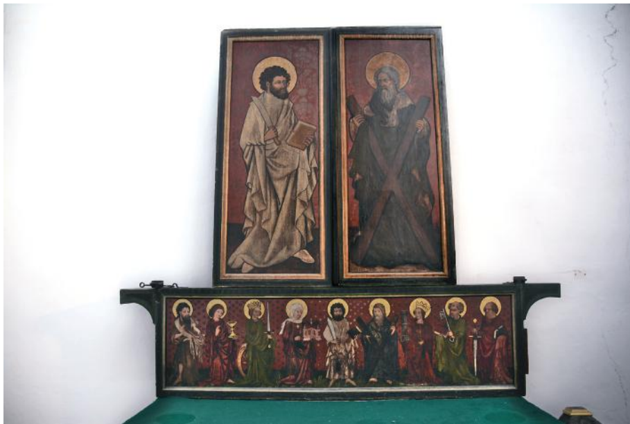
Il. 6. Kościół NMP w Gdańsku, kaplica św. Bartłomieja/Jadwigi, zamknięte retabulum ołtarzowe