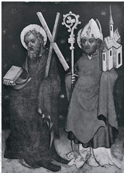
Il. 10. Wiedeń, Dom Museum, przedstawienie św. Andrzeja i św. Wolfganga, fragment retabulum z ok. 1425–1435 r., fot. wg Erzbischöfliches Dom und Diözesanmuseum Wien , hrsg. v. Erzbischöfliches Ordinariat, Wien 1973, s. 65–68, Abb. 47

Jadwidze. Jak wspomniano, jego ubiór nie jest wystarczającym argumentem za identyfikowaniem go jako św. Jakuba. W niemal identycznym stroju (płaszcz, futerały na nóż i okulary przytroczone do paska, którym przewiązana jest szata spodnia) Stefan Lochner przedstawił św. Łukasza na skrzydle ołtarzowym przechowywanym w zbiorach kolońskiego Wallraf-Richartz-Museum i datowanym na ok. 1445–1450 r. 109 Całościowa analiza programu obrazowego gdańskiej nastawy, a przede wszystkim jego zauważalna tematyczna spójność, pozwala interpretować tę postać raczej jako św. Andrzeja, wyobrażonego także na awersie skrzydeł oraz na predelli 110 . Takiej interpretacji mężczyzny nie potwierdza co prawda jego poza, która wyklucza podtrzymywanie przezeń dużych rozmiarów krzyża (jak ma to miejsce w obu wizerunkach malarskich). W bogatej ikonografii św. Andrzeja zdarzają się jednak przy-