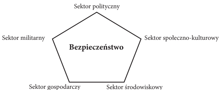
Rysunek 1. Bezpieczeństwo sektorowe w ujęciu szkoły kopenhaskiej