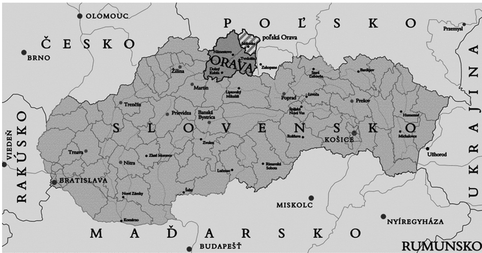
Zdjęcie 1. Mapa Orawy