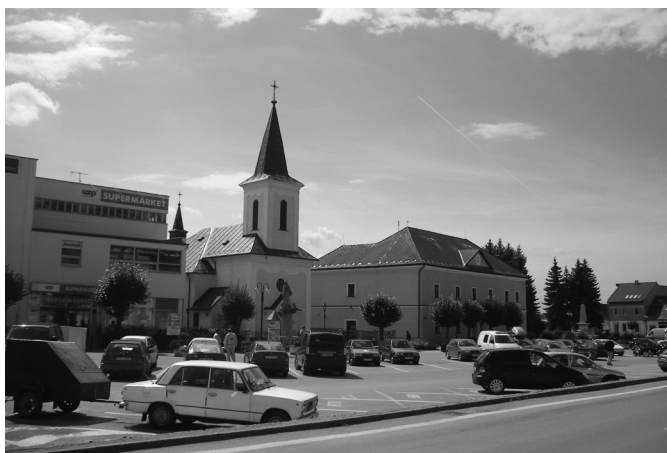
Zdjęcie 7. Rynek z Kościołem Franciszkanów

W Namiestowie natomiast znajduje się renesansowy kościół pw. świętych apostołów Szymona i Judy z połowy XVII wieku. Most nad zatoką Jeziora Orawskiego łączy główną część miasta z dzielnicą Slanická Osada , w której działa największa w Słowacji zawodowa szkoła hotelarsko-gastronomiczna. Na jeziorze leży jedyna pozostałość po zatopionej wsi Slanica – wyspa Slanický ostrov z zabytkowym kościołem z XVIII wieku, obecnie muzeum. Północna część miasta to typowe socjalistyczne blokowisko, w którym mieszka ponad połowa ludności miasta. Centrum Namiestowa przedstawia zdjęcie 9.