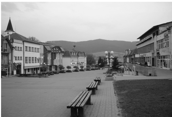
Zdjęcie 8. Główny plac w Namiestowie