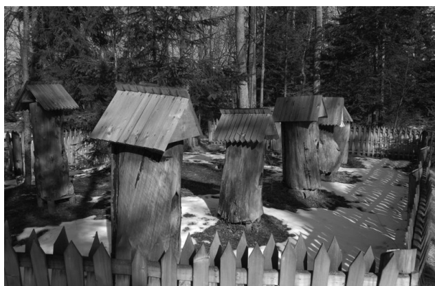
Zdjęcie 2 i 3. Skansen Orawski Park Etnograficzny w Zubrzycy Górnej