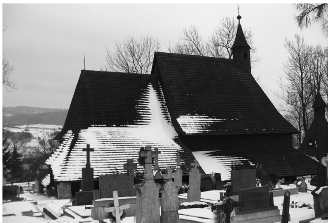
Zdjęcie 6. Drewniany Kościół Wszystkich Świętych w Twardoszynie