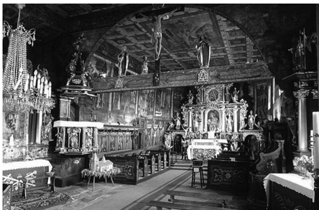
Zdjęcie 3 i 4. Kościół pw. św. Jana Chrzciciela w Orawie