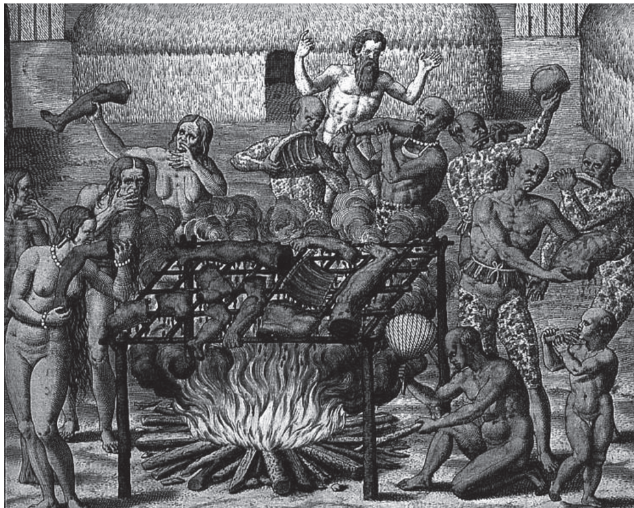
[1. Przyrządzanie ludzkiego mięsa na moquem , Theodore de Bry, Americae Tertia Pars , miedzioryt, Frankfurt 1592]

Oprócz mężczyzn Tupinamba i młodej Indianki na pierwszym planie, w głębi, po lewej stronie kompozycji widoczne są trzy postacie starych i niezgrabnych indiańskich kobiet. Ich wyniszczone ciała, zwiotczałe piersi, pomarszczona skóra, brzydkie twarze i brak ozdób pozostają w kontraście z wdzięczną postacią młodej Indianki o pełnych kształtach, zaokrąglonych piersiach i z ozdobnymi naszyjnikami na szyi oraz przegubach dłoni.