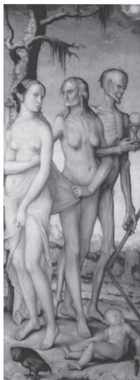
[7. Przyrządzanie ludzkiego mięsa na moquem , Theodore de Bry, Americae Tertia Pars , miedzioryt, Frankfurt 1592; Trzy etapy życia i śmierć, Hans Baldung, olej na desce, 151 x 61cm, 1539]