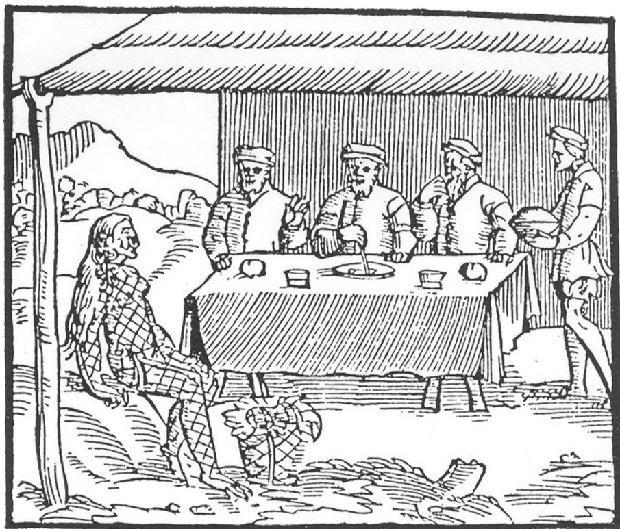
[4. Historia del Mondo Nuovo , Girolamo Benzoni, drzeworyt 1565]

Według interpretacji de Bouyer i Duviols wszystkie trzy wizerunki autorstwa de Bry – wąż o obwisłych piersiach, stare kobiety plemienia Tupinamba i odrażająca Indianka z Cumana – są związane z przedstawieniem symbolu demona i zła 20 . Bucher 21 odbiera w przesłaniu powyższych grafik chęć pohańbienia, ukarania i skazania na wieczne potępienie Indian Nowego Świata. Pogląd ten, w odniesieniu do starych Indianek Tupinamba praktykujących antropofagię, podzielają również Belluzzo 22 i Raminelli 23 . Baumann interpretuje zaś wi-