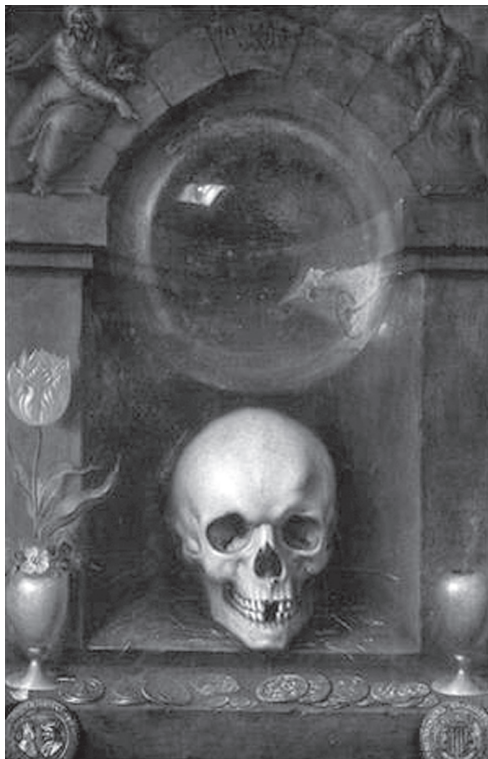
[8. Vanitas, Jacob de Gheyn II (1565–1629), olej 1603]

Dzieło Trzy etapy życia i śmierć Baldunga jest w gruncie rzeczy bardzo bliskie reprezentacjom starych indiańskich kobiet przedstawionych przez jego flamandzkiego kolegę. W rzeczywistości młoda Indianka i stare kobiety są ze sobą powiązane – ukazują przemijanie, a więc i przyszłość młodej i pięknej kobiety, to co ją czeka: degradacja ciała i starzenie się. De Bry posuwa się jednak w swoim założeniu dalej niż Baldung w Trzech etapach życia i nie tylko bezlitośnie pokazuje konsekwencje upływu czasu i utratę młodości oraz piękna, lecz ucieka się także do przedstawienia praktyk antropofagicznych, które jako czynny grzeszne i okrutne zobrazowane zostały poprzez fizyczną degradację ciała i jego rozkład [il. 7].