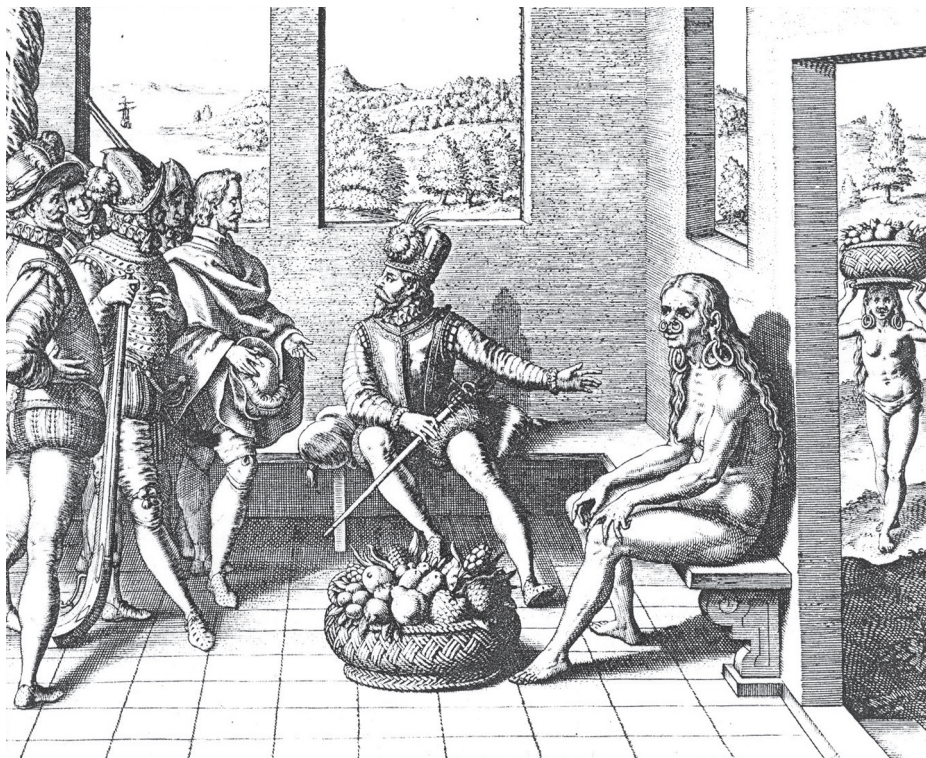
[3. Odrażająca Indianka z Cumana, Theodore de Bry, Americae Pars Quarta , rycina 1594]