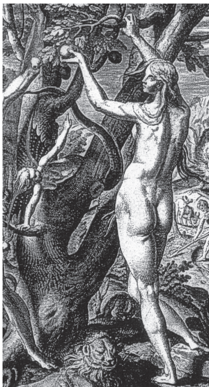
[2. Ewa i Wąż (fragment), Théodore de Bry, Adam i Ewa, Admiranda Narratio , rycina 1590]

W Americae Tertia Pars rycina Przyrządzenie ludzkiego mięsa pieczonego na «moquem» jest jedyną litografią, na której przedstawione są stare Indianki. Wydawca opublikował jednak również rycinę o podobnym przesłaniu w Admiranda Narratio , przedstawiającą Adama i Ewę w raju, z hybrydycznym wyobrażeniem szatana 17 , o tułowiu starej kobiety z obwisłymi piersiami i z twarzą młodej dziewczyny – o zoomorficznej, węzowej dolnej części ciała [il. 2].