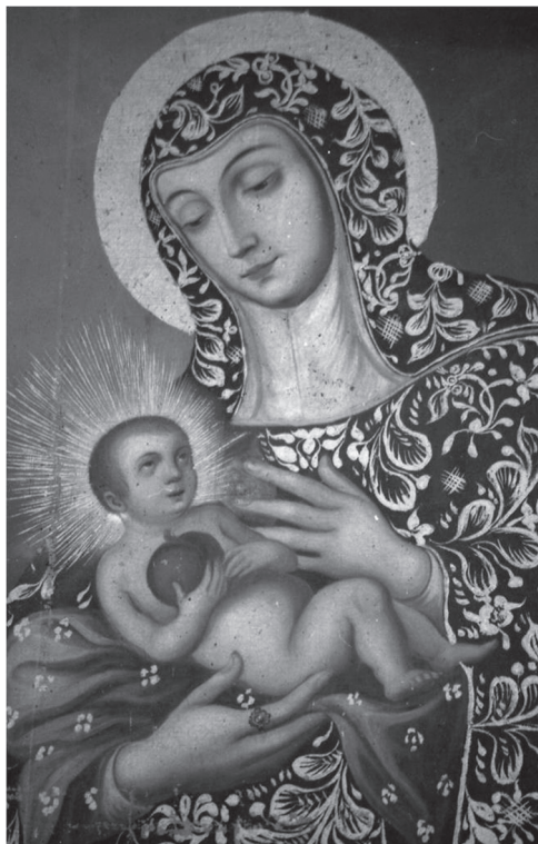
[7. Św. Gertruda z małym Jezusem, Rafael de la Peña, (fragment), XVIII w., olej na płótnie, Iztacuixtla, stan Tlaxcala]

Jak wytłumaczyć tego typu wizerunki, które dziś wydają się dość nietypowe, jeśli nie skandaliczne? Co prawda w kulturze iberoamerykańskiej i hiszpańskiej przedstawienia karmienia piersią świętych przez Matkę Boską nie są rzadkością, ale w tym przypadku role są odwrócone – to święta zakonnica karmi małego Jezusa. Niewątpliwie artyści lokalni inspirowali się tekstami drukowanymi, szczególnie tymi z XVIII w., gdzie wizje laktacji bywały wyeksponowane. Wcześniej była ona co prawda już obecna w ikonografii, ale w ujęciu bardziej subtelnym, w hiszpańskich wersjach dzieł św. Gertrudy z XVII w. 28 W anonimowych osiemnastowiecznych „krótkich streszczeniach życia św. Gertrudy” wydanych w Meksyku i w Puebli akcentuje się ten wątek, dodając że „w dziewiczych piersiach tej świętej Bóg stworzył cudowne mleko i nie-