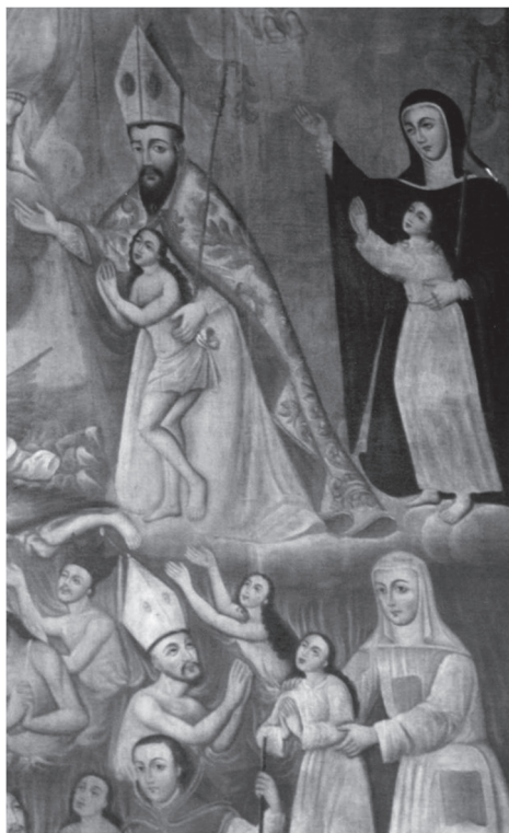
[5. Czyściec, anonim XVIII w. (fragment) olej na płótnie, Capulhuac, stan Meksyk ]