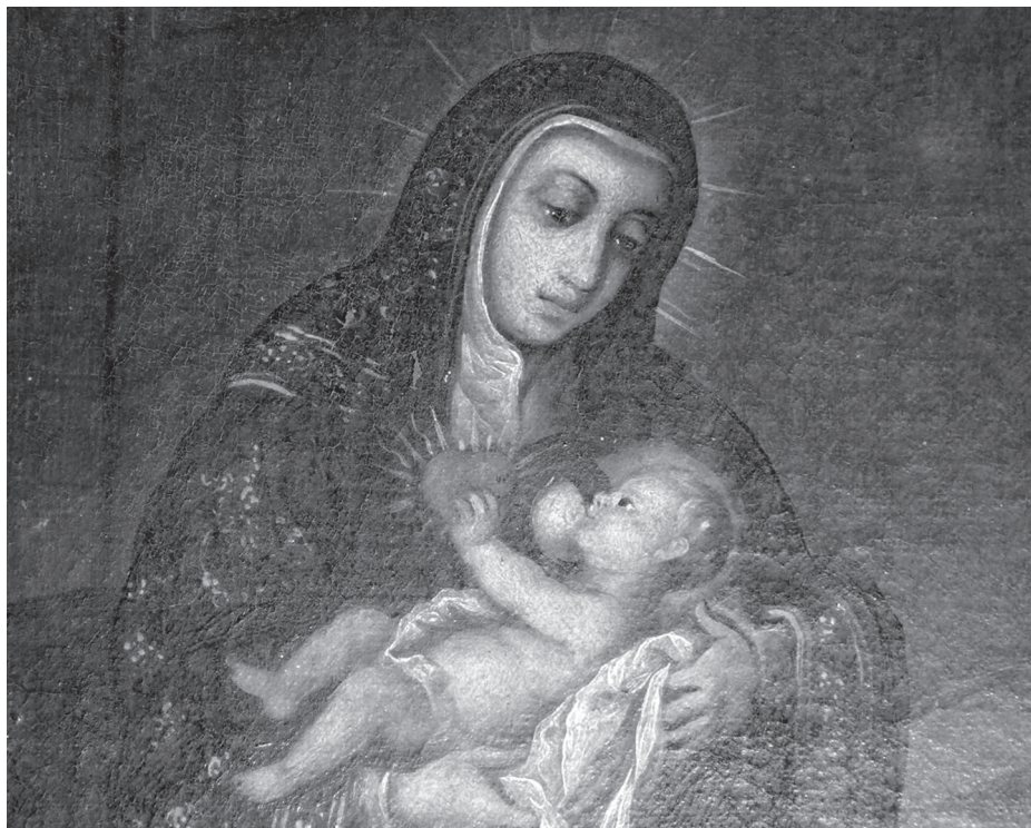
[8. Sceny z życia św. Gertrudy, Juan de Villegas i Pedro Rafaela Salazar (fragment), XVIII w., olej na płótnie, San Martín Texmelucan, stan Puebla]

rzadko Dziecko Jezus schodziło z łona swojej matki, żeby je pić i smakować się w tym najslodszy m nektarze” 29 . Tak więc lokalne reprezentacje plastyczne nabierają znaczenia, gdy analizujemy je w świetle rodzimej twórczości piśmiennej.