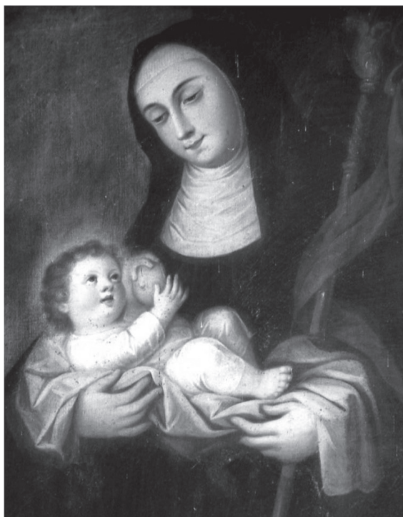
[6. Św. Gertruda z małym Jezusem, anonim (fragment), XVIII w., olej na płótnie, Santa Cruz y la Soledad, miasto Meksyk ]