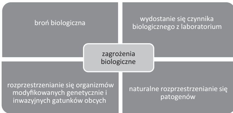
Schemat 1. Składniki bezpieczeństwa biologicznego

Bezpieczeństwo biologiczne najczęściej analizowane jest przez pryzmat bioterroryzmu, wytycznych w zakresie zapewnienia odpowiednich procedur w laboratoriach chroniących przed niekontrolowanym przedostaniem się czynników biologicznych na zewnątrz oraz wprowadzaniem do środowiska organizmów modyfikowanych genetycznie.