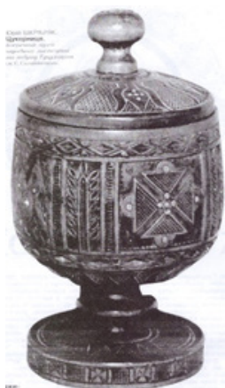
Зобр. 1. Рахва з порохівниці. Коломийський музей народного мистецтва Побуту Гуцульщини ім. Є. Сагайдачного

На власноруч виготовленій токарні майстер виточував куделі, порохівниці, рахви, пляшки, цукерниці, бочівки, чарки, барильця. Виготовляючи долота, поліпшував техніку різьблення, запровадив нові орнаментальні мотиви і творив власну манеру так званого «шкрібляківського різьблення» зображ. 1, 2.