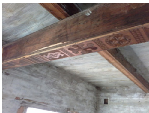
Зобр. 3. Юрій Шкрібляк Різьблена балка в інтер'єрі. м. Косів Івано-Франківська обл.