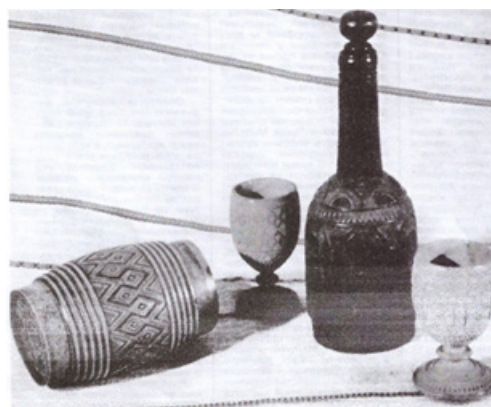
Зобр. 4. Юрій Шкрібляк Бочівка, пляшка, чарки-порції. Косівський музей народного мистецтва Гуцульщини і Покуття ім. Й. Кобринського

Шкрібляка (1880) декорована різьбленням та жируванням металевим дротиком і цятками, зберігається у Національному музеї народного декоративного мистецтва у Києві (Molin, 2018, с. 1165).