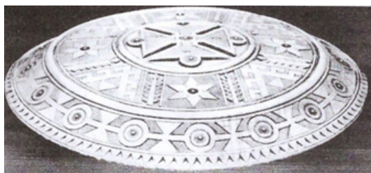
Зобр. 5. Микола Шкрібляк. Рахва. Музей Косівського державного інституту прикладного та декоративного мистецтва