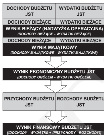
Rys. 1. Elementy równoważenia budżetu JST