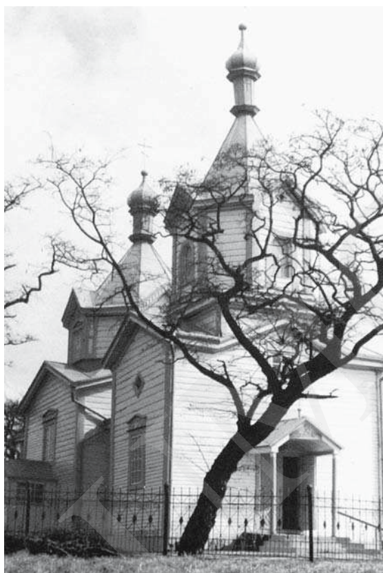
Il. 2. Michale – cerkiew, fot. M. Коц. Repр. z: Л. Бабич, В. Свистун, Храми Волині , Луцьк 2004, s. 36.