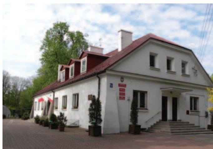
Ilustracja 4. Budynek dworu – elewacja północna (2012).