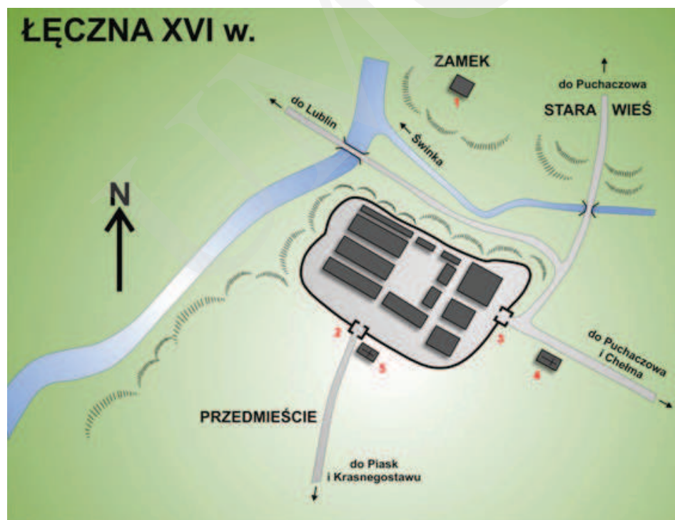
Ilustracja 1. Rekonstrukcja układu przestrzennego miasta Łęczna w XVI wieku. 1 – Zamek; 2 – Brama Krasnostawska; 3 – Brama Chełmska; 4 – Kościół parafialny; 5 – Kościół szpitalny Św. Ducha, oprac. M. Dudkiewicz, wg Maciuka, [w:] Łęczna. Studia z dziejów miasta , red. E. Horoch, Łęczna 1989, s. 38.

Pierwsza wzmianka o Łęcznej – z pisownią Łaczna – pochodzi z 1252 roku. Była to wówczas własność opactwa sieciechowskiego, a później, w roku 1428, Stefana z Łęcznej. Ziemie łączyńskie leżały na granicy wpływów Małopolan, pomiędzy województwem chełmskim i Księstwem Halicko-Wołyńskim, co prawdopodobnie było przyczyną wzniesienia na skraju wysokiego ujścia Świnki do Wieprza zamku obronnego 1 (zob. il. 1). 7 stycznia 1467 roku Kazimierz Jagiellończyk nadał Łęcznej prawa miejskie. Miasto osadzono na 36 łanach na skrzyżowaniu dwóch szlaków handlowych: z Wołunia do Lublina, i z Podkarpacia na Podlasie 2 .