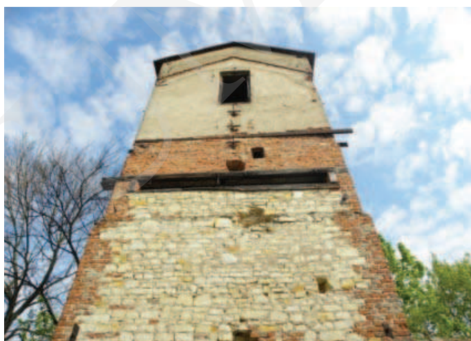
Ilustracja 6. Budynek suszarni chmielu – elewacja południowa, fot. M. Dudkiewicz (2012).

Przeprowadzone analizy wskazują na brak opieki i niszczące zmiany w substancji zabytkowej parku i budynków zespołu dworskiego w Łęcznej. Inwentaryzacja ukazała zarastanie parku krajobrazowego, gdzie drzewa i krzewy tworzą niekontrolowane, przypadkowe skupiska oraz niszczące budynki folwarku. Niewątpliwie jednak obiekt zasługuje na uwagę ze względów historycznych, przyrodniczych oraz jako zabytek sztuki ogrodowej.