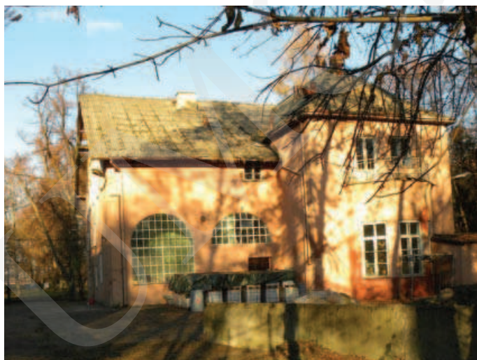
Ilustracja 3. Budynek pałacu – elewacja południowa, fot. M. Dudkiewicz (2012).

Ogólna inwentaryzacja architektoniczna przeprowadzona w 2012 roku (zob. il. 3-6) wykazała, że budynek z roku 1881 jest w stanie ruiny. Obiekt ten był wzniesiony na planie prostokąta, z dachem dwuspadowym, ścianami wykonanym z cegły i opoki wapiennej, naprożami okien ceglany i łukowymi. W sąsiednim budynku – suszarni – jest zachowane deskowanie więźby dachowej, w kształcie koperty, z zewnątrz dach dwuspadowy. W magazynie układ dachu płatwiowo-kleszczowy, kleszcze w przekroju okrągłym, z bali. Strop opiera się na drewnianych słupach, ściany murowane z cegły dziurawki. Dach nakryty eternitem z zaakcentowanymi narożnikami.