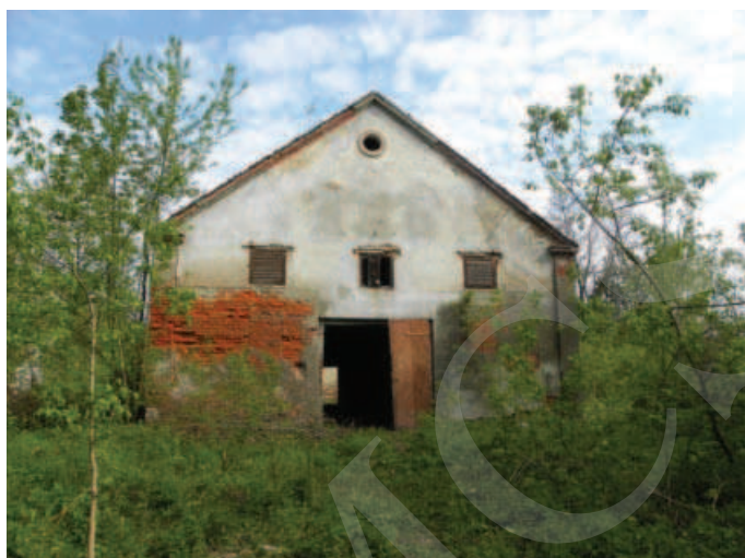
Ilustracja 5. Budynek magazynu – elewacja południowa, fot. M. Dudkiewicz (2012).