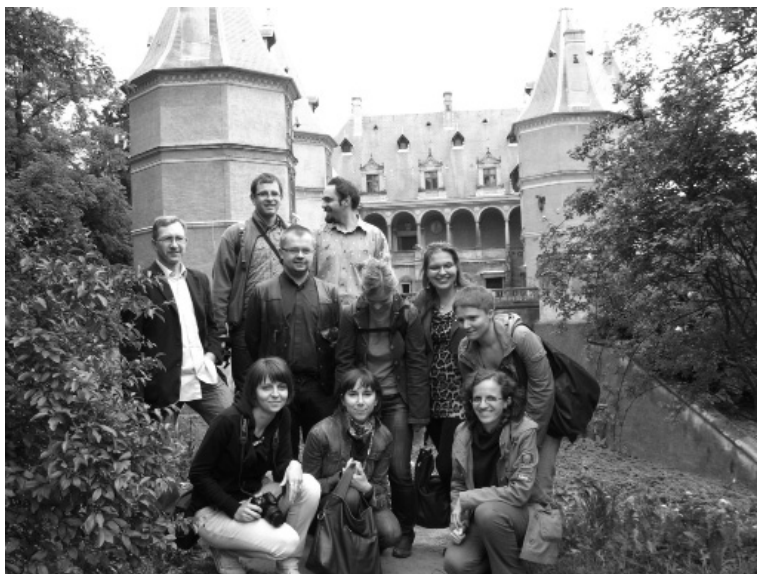
Fot. 3. Przed zamkiem w Gołuchowie, 2011 r.