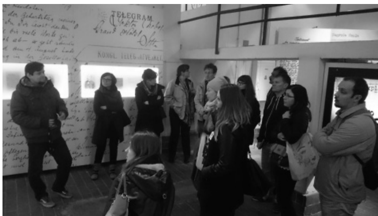
Fot. 7. Podczas zwiedzania Exploseum, Oddział Muzeum Okręgowego w Bydgoszczy, 2016 r.