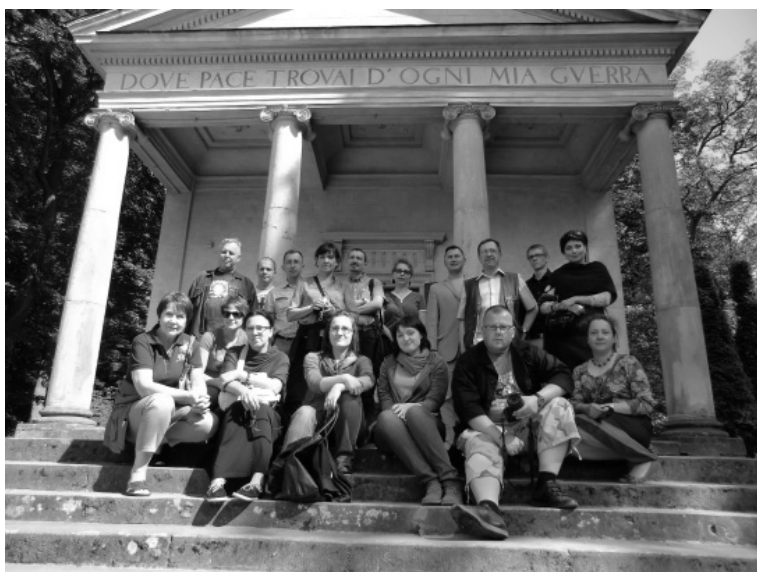
Fot. 4. Przed świątynią Diany w Arkadii, 2012 r.