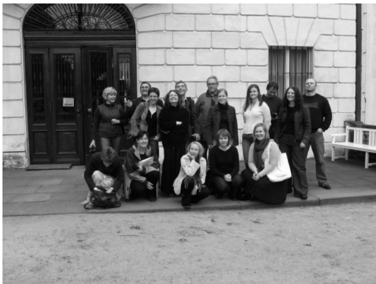
Fot. 1. Przed pałacem w Nieborowie, 2009 r.