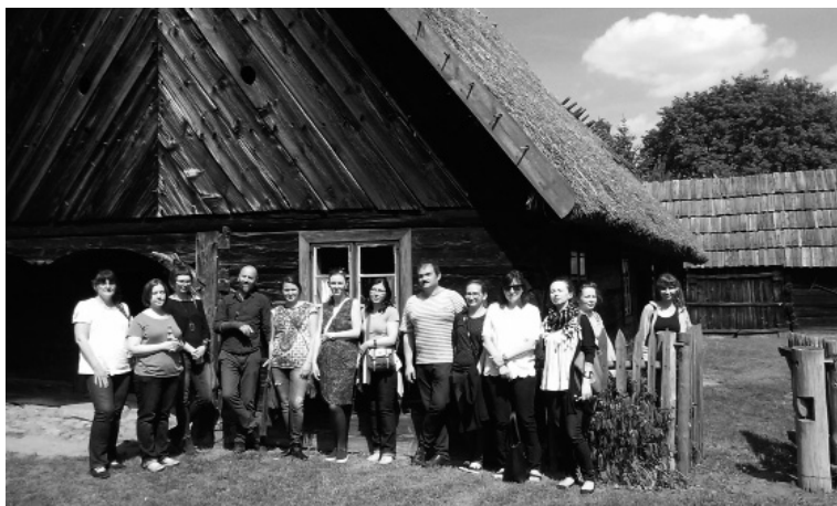
Fot. 6. Zajęcia w Muzeum Etnograficznym w Toruniu, 2016 r.