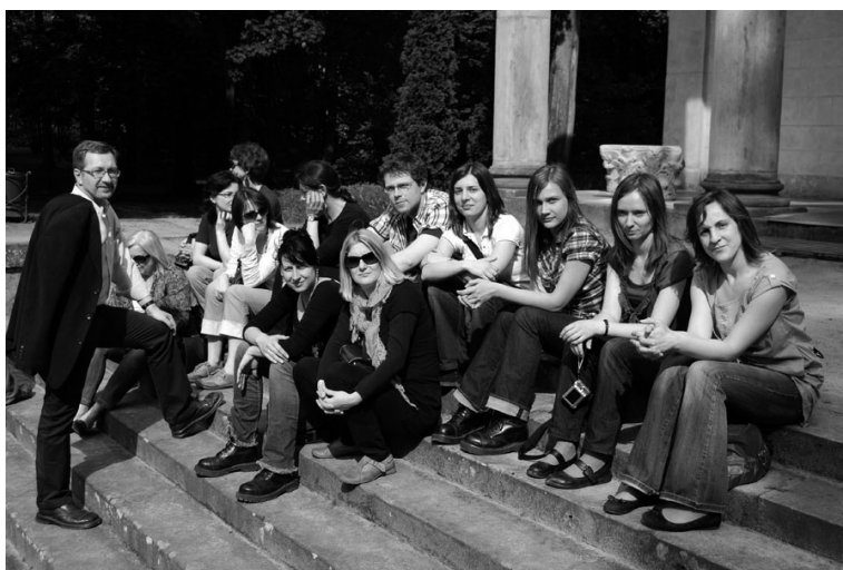
Fot. 2. Przed świątynią Diany w Arkadii, 2010 r.