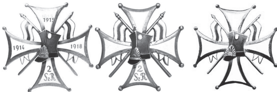
Rycina 3. Odznaki szwoleżerów: od lewej 2. pSzR pierwszego wzoru, 2. pSzR drugiego wzoru i 2. br Szwoleżerów Rokitniańskich (opracowanie własne)

Szwoleżerskie tradycje w Stargardzie Szczecińskim nie funkcjonowały jednak długo. Dwa lata później rozwiązano 2. Pomorską Dywizję Zmechanizowaną i większość jednostek wchodzących w jej skład, w tym 2. Batalion Rozpoznawczy Szwoleżerów Rokitniańskich. Tradycji tej jednostki nie przekazano żadnej innej formacji Wojska Polskiego. Coś jednak pozostało, choć w symbolicznym wymiarze. Rysunek odznaki 2. pSzR prezentowany jest dziś w sali tradycji 7. Pomorskiej BOW w Słupsku, która dziedziczy tradycje Pomorskiej Brygady Kawalerii, w skład której wchodził starogardzki pułk.