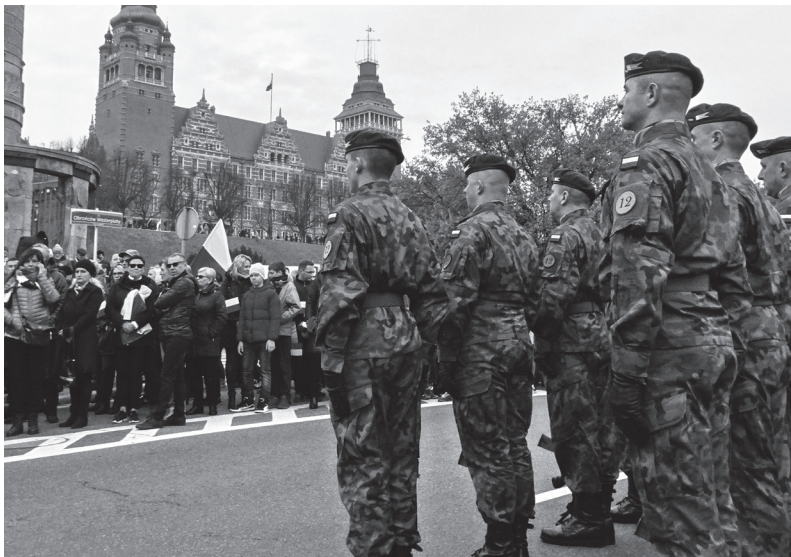
Rycina 2. Żołnierze 2. bpmot Ułanów Jazłowieckich 12. BZ podczas obchodów święta 100 rocznicy nieodległości. Zwracają uwagę proporczyki na beretach i oznaki 12. BZ na rękawach. Szczecin, Wały Chrobrego 11 listopada 2018 roku

Kanclerz Kapituły Orderu Wojennego Virtuti Militari gen. bryg. w st. spocz. Stanisław Nałęcz-Komornicki w 1999 roku podjął rozmowy z przedstawicielami Rodziny Jazłowieckiej w sprawie utożsamienia 1. Batalionu Czołgów im. 14. Pułku Ułanów Jazłowieckich z poprzednikiem. Miało to nastąpić w drodze przeniesienia Krzyża Srebrnego Orderu Wojennego Virtuti Militari z historycznego sztandaru pułku na proporzec batalionu, ale sprzeciwiło się temu londyńskie Koło Pułkowe 14. Pułku Ułanów Jazłowieckich. Dopiero po jego rozwiązaniu się i po uzyskaniu zgody wszystkich żyjących weteranów pułku, nastąpiło utożsamienie stargardzkiego 14. batalionu Ułanów Jazłowieckich z 14. Pułkiem Ułanów Jazłowieckich. Doszło do tego 9 stycznia 2008 roku, w trakcie uroczystego pożegnania sformowanej na bazie 12. Brygady Zmechanizowanej X zmiany Polskiego Kontyngentu Wojskowego w Iraku, której rdzeń stanowił 14. batalion Ułanów Jazłowieckich. Order Wojenny Virtuti Militari na sztandar pododdziału przeniósł kanclerz Kapituły Orderu Wojennego Virtuti Militari gen. bryg. w st. spocz. Stanisław Nałęcz-Komornicki. Tym samym dokonał się ostatni akt procesu przekazania bojowych dokonań sławnych poprzedników następcom ze Stargardu.