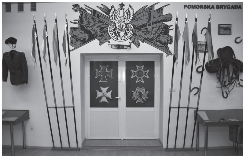
Rycina 4. Imitacje lanc z proporczykami i odznaki pułków Pomorskiej BK, wśród nich symbole 2. Pułku Szwoleżerów Rokitniańskich, ostatnie „żywe” elementy odwołujące się do tradycji tej jednostki. Słupsk, 2019 rok

Szwoleżerskie tradycje w Stargardzie Szczecińskim nie funkcjonowały jednak długo. Dwa lata później rozwiązano 2. Pomorską Dywizję Zmechanizowaną i większość jednostek wchodzących w jej skład, w tym 2. Batalion Rozpoznawczy Szwoleżerów Rokitniańskich. Tradycji tej jednostki nie przekazano żadnej innej formacji Wojska Polskiego. Coś jednak pozostało, choć w symbolicznym wymiarze. Rysunek odznaki 2. pSzR prezentowany jest dziś w sali tradycji 7. Pomorskiej BOW w Słupsku, która dziedziczy tradycje Pomorskiej Brygady Kawalerii, w skład której wchodził starogardzki pułk.