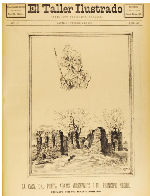
1. La casa del Poeta Adam Mickiewicz y el Príncipe Negro, dibujado por don Ignacio Domeyko, Portada El Taller Ilustrado, 4 de febrero de 1889.