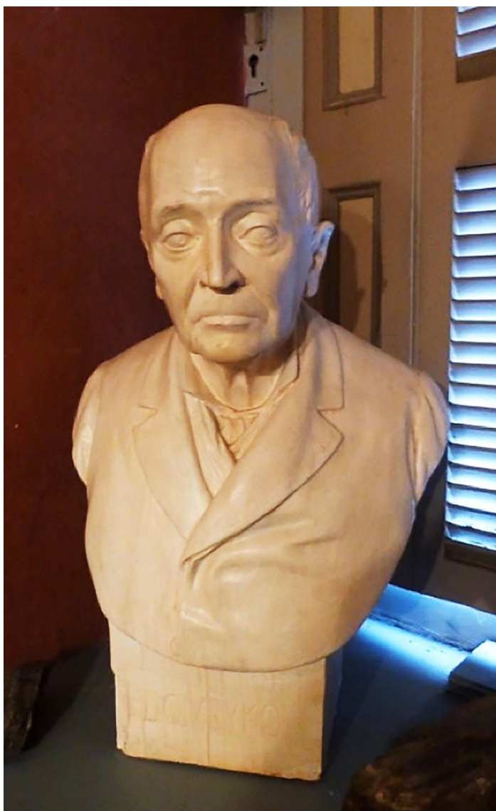
3. José Miguel Blanco, Busto de Ignacio Domeyko , 1884. Colección particular