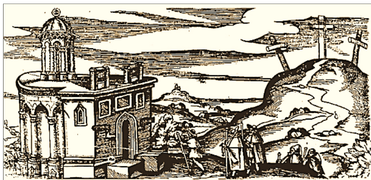
Ryc. 5. Christoph Kueffler, Boży Grób w Görlitz, Berlin 1642.

Istnieje przypuszczenie, że ten właśnie relikwiarz stanowił wzór także dla przeworskiej kopii Sepulchrum Domini 16 .