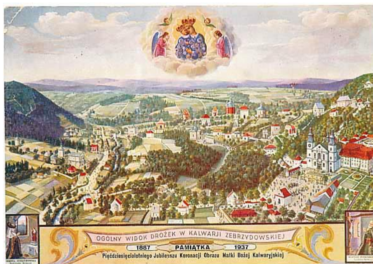
Ryc. 6. Kalwaria Zebrzydowska, karta okolicznościowa z 1937 r.

Wraz z budową nowych kalwarii zmieniał się także charakter sprawowanego w nim kultu. Do kaplic poświęconych Chrystusowi dołączano bowiem, już w pierwszej połowie XVII wieku, kaplice poświęcone Matce Bożej. Tym sposobem kalwarie stawały się także ośrodkami kultu maryjnego, czego wyraźnym przykładem są Kalwaria Zebrzydowska i Kalwaria Pałacowska.