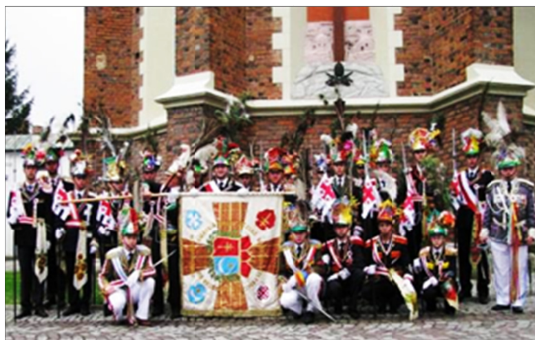
Ryc. 13. Członkowie Stowarzyszenia Straży Grobu Bożego „Gwardia” w Przeworsku

Zwykle wczesnym rankiem w Wielką Niedzielę lub jeszcze w poprzedzającą noc w niektórych wsiach „Turki” „budzą wiernych na rezurekcję” biciem w werbel (wieś Nowosielce), strzelaniem z bani, czyli z metalowej bańki na mleko, z puszek przy użyciu karbidu, z hyzli, tzn. rodzaju działa wykonanego domowym sposobem z wąskiej butli po acetylenie (to głównie w oddziałach ze wsi Mirocin i Ujezdna), z rury lub inaczej z klucza wypełnionego siarką i karbidem, a także już zupełnie nowocześnie za pomocą odpalanych petard. We wsi Dębów zwyczaj budzenia na rezurekcję bębnieniem, połączonym ze śpiewaniem pieśni wielkanocnych, został zarzucony, natomiast miejscowy oddział „Turków” strzela z działa armatniego, a towarzysząca im czasami orkiestra jeszcze przed szóstą rano odgrywa melodię marszową „na pobudkę” mieszkańcom wiosek.