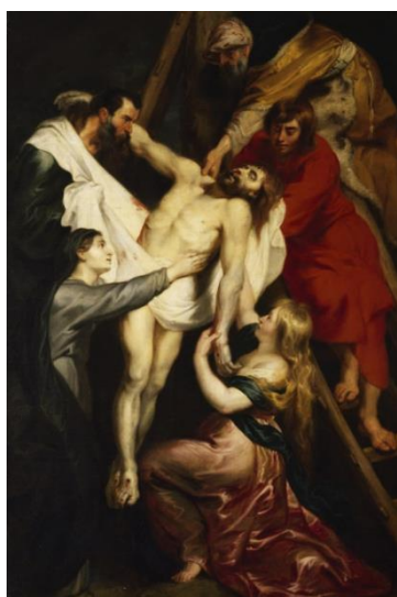
Ryc. 1. Peter Paul Rubens, Zdjęcie z Krzyża, 1610 r.

Już w starożytności i średniowieczu stawały się obiektami czci wiernych, na co wskazują pierwsze pielgrzymki do Jerozolimy, odbywane mniej więcej już od początku IV wieku, a zwłaszcza najstarszy opis sanktuariów jerozolimskich oraz nabożeństw liturgicznych wielkotygodniowych, zawarty chociażby w relacji Eterii zwanej Sylwią 2 .