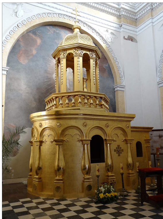
Ryc. 14. Replika Bożego Grobu w Bazylice w Przeworsku, stan obecny

Msza św. według formularza o Grobie Chrystusa jest odprawiana w przeworskim sanktuarium także jako Msza wotywa w piątki, w które nie przypada uroczystość, święto lub wspomnienie obowiązkowe, a także gdy pozwala na to okres roku kościelnego. Miejscem celebracji jest ołtarz wewnątrz Grobu Pańskiego. Szkoda tylko, że ta Msza św. nie jest odprawiana tak regularnie, jak można by sobie tego życzyć.