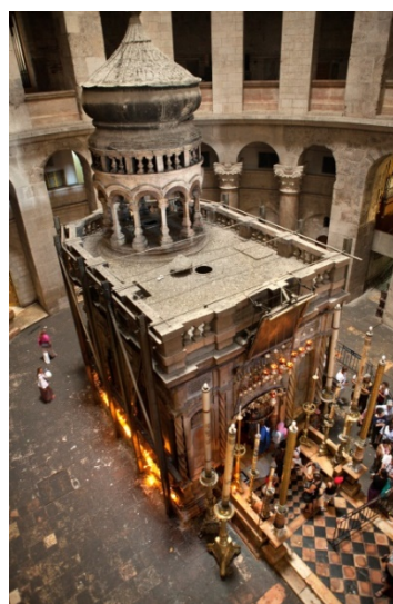
Ryc. 2. Anastasis – edykuła Grobu Pańskiego w Jerozolimie

Charakterystycznym znakiem związanym z Grobem Pańskim stał się podwójny czerwony krzyż patriarchalny, który wygląda jak krzyż łaciński z jedną dodatkową, krótszą poprzeczką powyżej, która ma symbolizować deskę z napisem „Jesus Nazarenus Rex Iudaeorum” (INRI), umieszczoną na krzyżu nad głową Chrystusa. Według legendy Maryja, Matka Jezusa, oznajmiła Jakubowi Młodszemu stojącemu przy ukrzyżowanym Synu, że zostanie pierwszym biskupem prawowiernych w Jerozolimie oraz stróżem Grobu Chrystusa. Mówiąc to, naznaczyła palcem umoczonym we krwi Jezusa krzyż na szacie Apostoła, dodając ową drugą belkę. Umieszczenie w tej scenie podwójnego krzyża, używanego potem przez bożogrobców, miało sugerować i podkreślać ścisły związek tego zakonu z propagowaniem kultu i idei Krzyża Świętego 3 . W tradycji bożo-