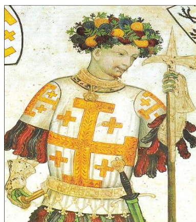
Ryc. 4. Książę Godfrey de Bouillon (1058-1100), obrońca Grobu Świętego, współtwórca zakonu bożogrobców.

W Królestwie Polskim natomiast w tamtych czasach bożogrobcy przeżywali okres swojego znacznego rozwoju. Pod popularną nazwą bożogrobców funkcjonowały lub funkcjonują trzy instytucje zakonne: zakon kłerycki Kanoników Regularnych Stróżów Grobu Świętego Jerozolimskiego, grupa rycerzy, będących ich militarnym wsparciem i pod koniec XV wieku przekształconej w Zakon Rycerzy Grobu Świętego, oraz współcześnie działające stowarzyszenie osób duchownych i świeckich jako Zakon Rycerski Grobu Świętego Jerozolimskiego (w Polsce pod nazwą Zakon Rycerski Grobu Bożego w Jerozolimie). Do Polski zakon kłerycki bożogrobców został sprowadzony z Jerozolimy już w drugiej połowie XII wieku przez Jaksę, księcia serbo-łużyckiego (z Kopniku) i dygnitarza małopolskiego. Jaksza ufundował im kościół i klasztor w Miechowie. To miejsce, z repliką Grobu Bożego w Jerozolimie, z każdym dziesięcioleciem zyskiwało na znaczeniu religijnym 10 . Zarówno książęta piastowscy, jak i rycerstwo polskie chętnie odwiedzało miechowskie sanktuarium, obdarowując je wieloma donacjami.