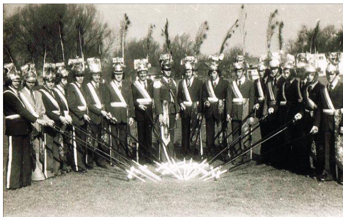
Ryc. 11. „Turki” — Straż Grobowa. Mirocin 1974 r.