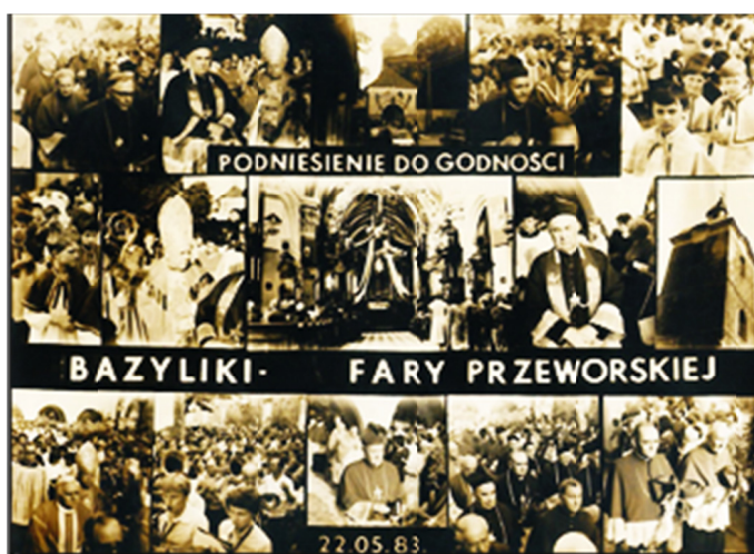
Ryc. 12. Pamiątkowe portfolio fotografii z uroczystości podniesienia do godności Bazyliki Mniejszej fary w Przeworsku, 22 maja 1983 r.

rzył punkt katechetyczny w Przeworsku i koordynował tam nauczanie religii w czasach, kiedy było ono zakazane w szkołach. W sposób szczególny przyczynił się zwłaszcza do rekonstrukcji i rozpowszechnienia tradycji sanktuarium Grobu Chrystusa w Przeworsku, poprzez renowację wiernej kopii Kaplicy Grobowej z Jerozolimy i wznowienia Misterium Wielkanocnego 100 .