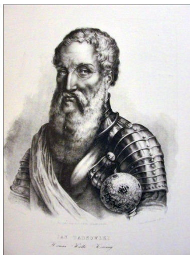
Ryc. 7. Jan Amor Tarnowski (1488-1561).