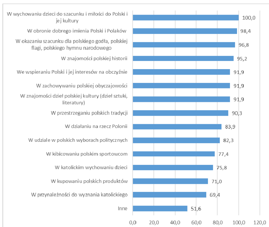
Wykres 2. Zachowania patriotyczne w opinii respondentów (%) (N=62)

Źródło: Badanie pilotażowe „Transmisja kulturowo-religijna w polskich parafiach i ośrodkach duszpasterskich we Francji”. Pytanie brzmiało: „W czym według Pana(i) przejawia się patriotyzm?”