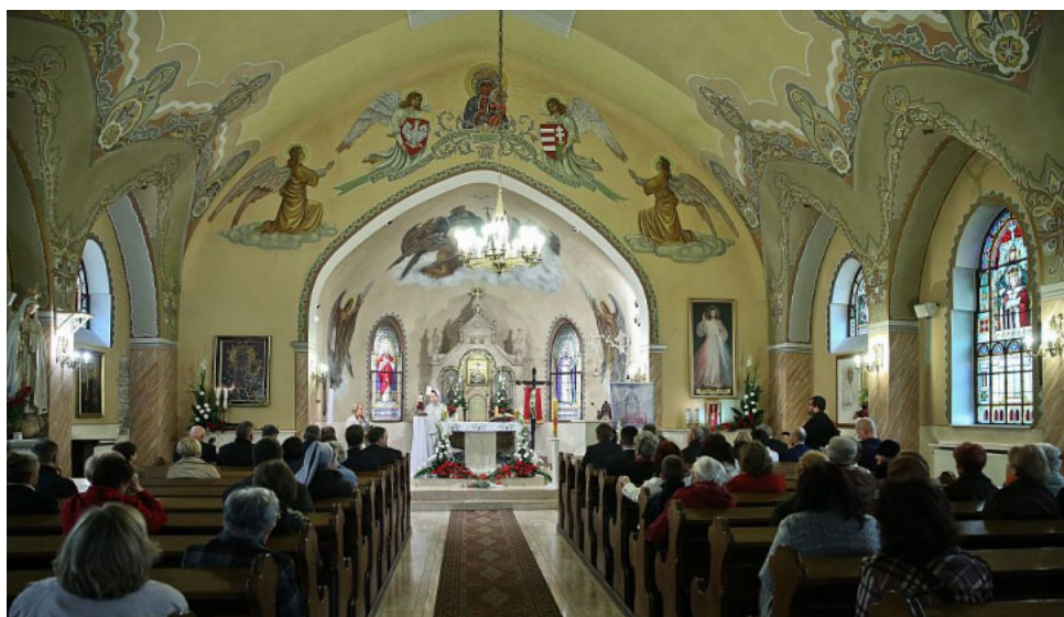
8. Nawa główna w kierunku prezbiterium kościoła pw. NMP Wspomożycielki Wiernych w Budapeszcie (fot. współczesna)