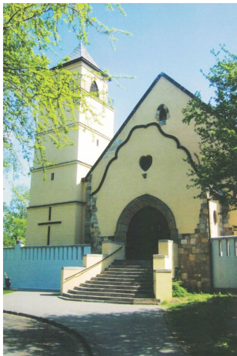
5. Fasada kościoła pw. NMP Wspomożycielki Wiernych w Budapeszcie (fot. współczesna)