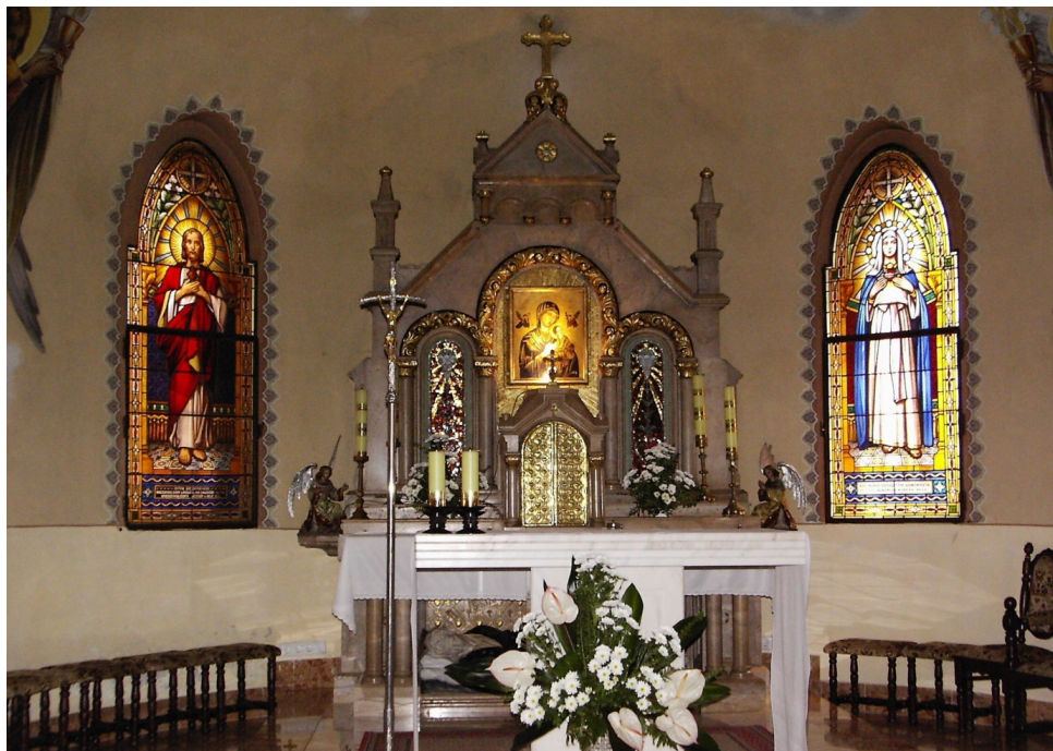
7. Prezbiterium i ołtarz główny kościoła pw. NMP Wspomożycielki Wiernych w Budapeszcie (fot. współczesna)