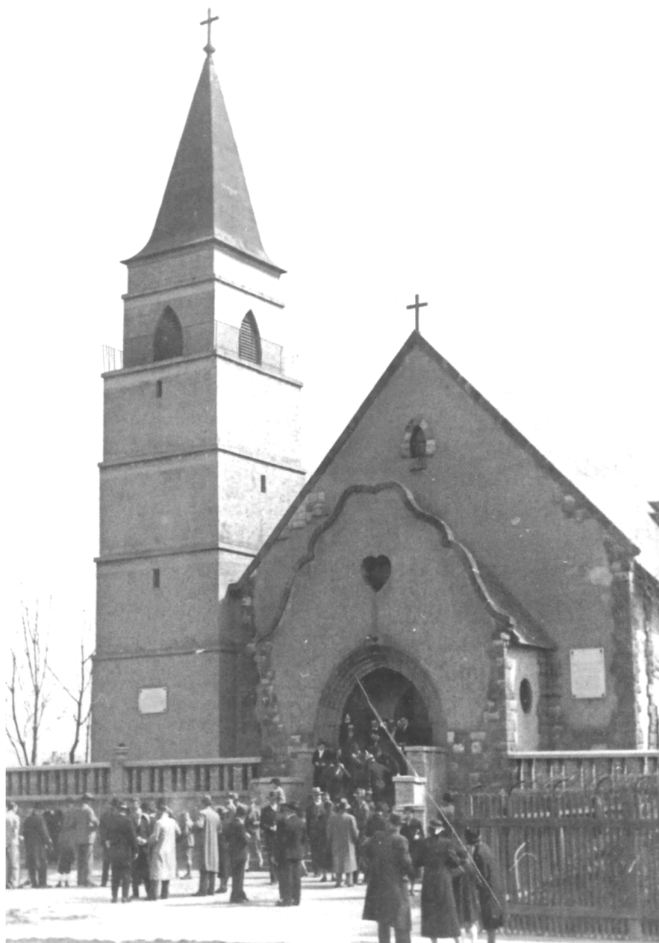
4. Kościół pw. NMP Wspomożycielki Wiernych w Budapeszcie (lata 30. XX wieku)