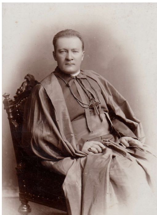
1. Metropolita lwowski ob. łac. abp Józef Bilczewski (1860-1923)