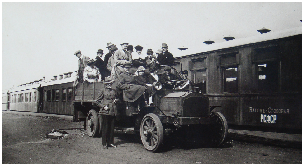
3. Delegacja polska na dworcu w Moskwie – 28 sierpnia 1921 r.