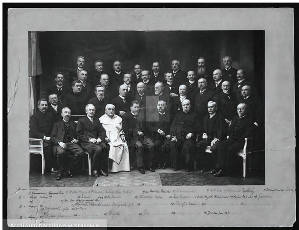
6. Fotografia zbiorowa weteranów powstania styczniowego (Archiwum Narodowe w Krakowie, Przynalisko Weteranów Powstania 1863/1864 r. w Krakowie, sygn. 39)