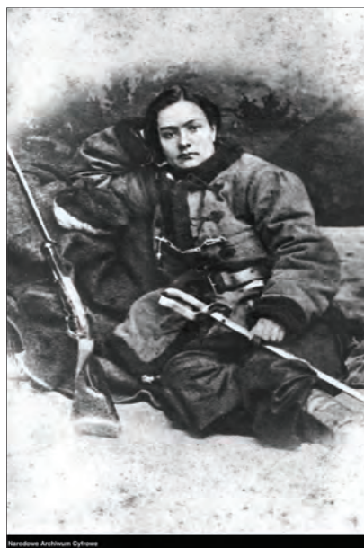
3. Fotografia Henryki Pustowójtówny (NAC, Koncern Ilustrowany Kurier Codzienny – Archiwum Ilustracji, sygn. 1/1b)