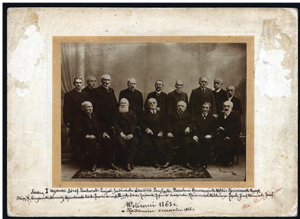
7. Fotografia założycieli Stowarzyszenia Wzajemnej Pomocy Uczestników Powstania 1863 r. Koła w Radomiu, 1916 r.