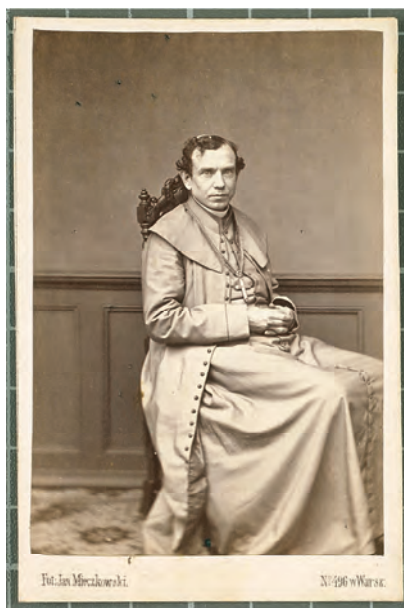
2. Fotografia arcybiskupa Zygmunta Szczęsnego Felińskiego z okresu żałoby narodowej w 1861 r. (AGAD, Zbiór fotografii Oddziału III, Album nr 7)