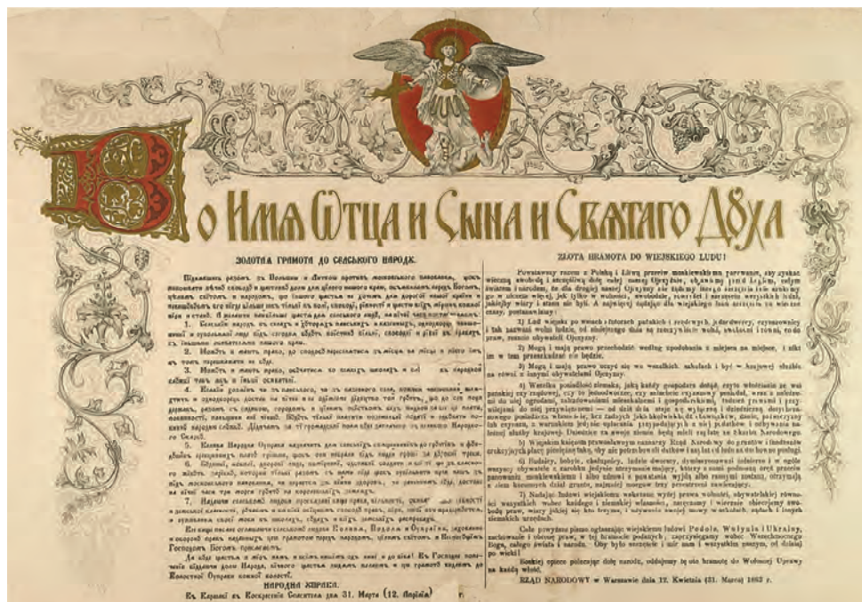
1. Złota Hramota. Dekret uwłaszczeniowy dla mieszkańców Podola, Wołynia i Ukrainy, 31III/12IV 1863 r. (AGAD, Organizacja Narodowa Powstania Styczniowego, sygn. 12)