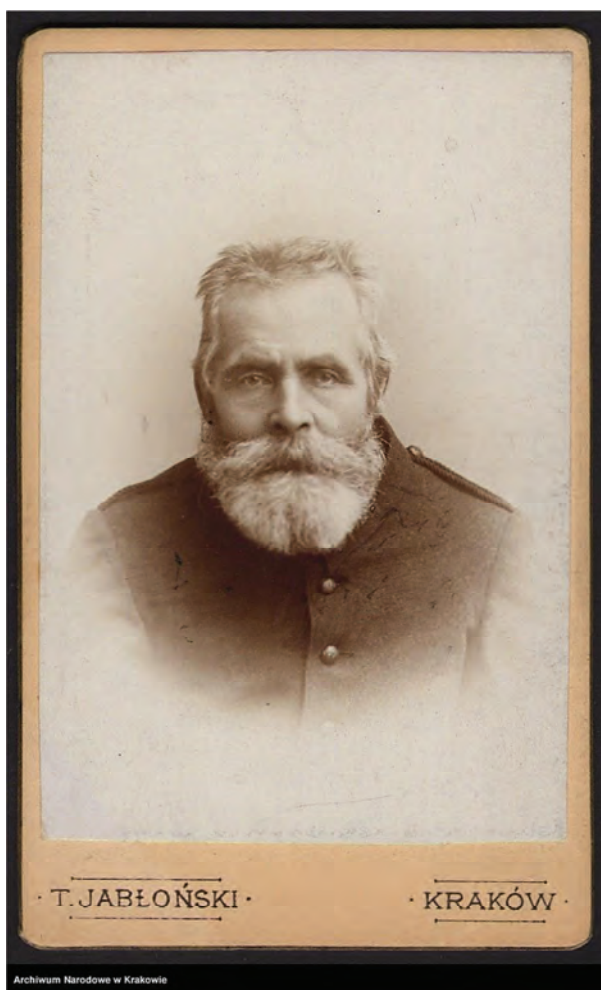
5. Teodor Kułakowski – powstanie styczniowy