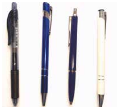
Zdjęcie 1. Prawda materialna a prawda kontrolerska względem liczby długopisów. [Opis w tekście].