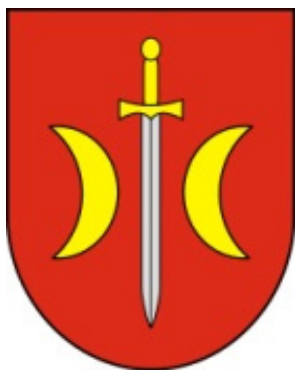
Fot. 1. Herb Konstantynowa Łódzkiego

Rzeczywistość lat 90. ubiegłego stulecia 6 w znaczący sposób odbiegała od tej z pierwszej dekady XXI wieku 7 . Cztery następne lata również rządziły się swoimi prawami. Zasadniczym celem przedstawianego opracowania jest prezentacja wybranego pisma oraz próba odnalezienia odpowiedzi na następujące, szczegółowe pytania badawcze: jak przez owe ćwierć wieku zmieniał się analizowany periodyk? Co stanowiło o jego sile, a co decydowało o słabości? Czy realizował on funkcje przypisywane tego typu prasie, wpisując się w definicję pism lokalnych? Jakie elementy sprawiły, że utrzymał się na wymagającym rynku prasowym, w którym reguły zdają się dyktować nie tylko odbiorcy, ale i silne, o ugruntowanej pozycji koncerny medialne, inwestujące również w rynek prasy regionalnej?