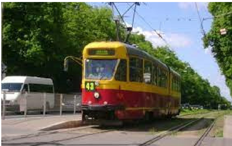
Fot. 2. Tramwaj, którego numer stał się inspiracją dla nadania tytułu „Wiadomości – 43 bis”