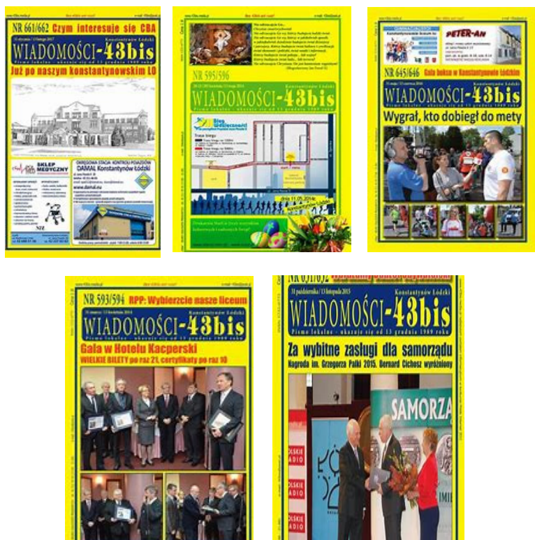
Fot. 4–8. Wybrane okładki „Wiadomości – 43 bis”

Z okazji świąt wydania były nieco atrakcyjniejsze. Stopniowo zawartość periodyku drukowana była na coraz lepszej jakości papierze. Poniżej zamieszczono zdjęcia przykładowych okładek omawianego czasopisma (Fot. 4–8).