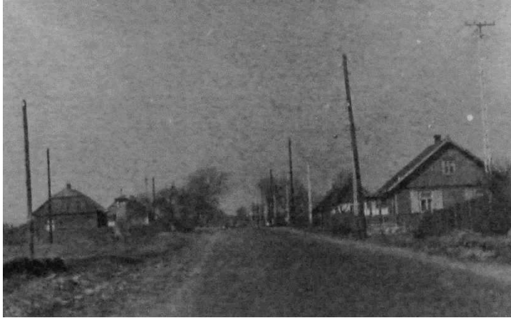
Ryc. 6. Stąporków, fot. Z. Mączyński, 1969 r., zbiory prywatne

Zakłady w Stąporkowie utrzymywały od pokoleń wiele rodzin z obszaru ziemi koneckiej. Tradycje zawodowe były podtrzymywane przez kolejne pokolenia. W 1967 r. Stąporków uzyskał prawa miejskie, a w jego herbie znajdują się elementy nawiązujące do tradycji przemysłowych. Rolniczy charakter osady w kolejnych dekadach ulegał stopniowemu zatarciu.