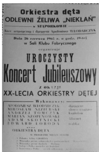
Ryc. 4. Plakat, Uroczysty Koncert Jubileuszowy z okazji XX-lecia Orkiestry Dętej, fot. Z. Mączyński, 1965 r., zbiory prywatne

Odlewnia była głównym przedsięwzięciem inwestującym w rozwój osady. Większość pracowników przyjeżdżała z okolicznych wsi, część prznosiła się do mieszkań zakładowych. Większość z nich nie porzucała jednak swoich gospodarstw. Jak wspomina W. Zarzycka: „Dużo ludzi ze wsi przyszło pracować w odlewni, ale jak pozostawiali gospodarstwo, to popołudniu jechali, utrzymywali pola. [...] Pola były uprawiane, ludzie nawet na czas żniw i wykopków dostawali urlopy” 40 .