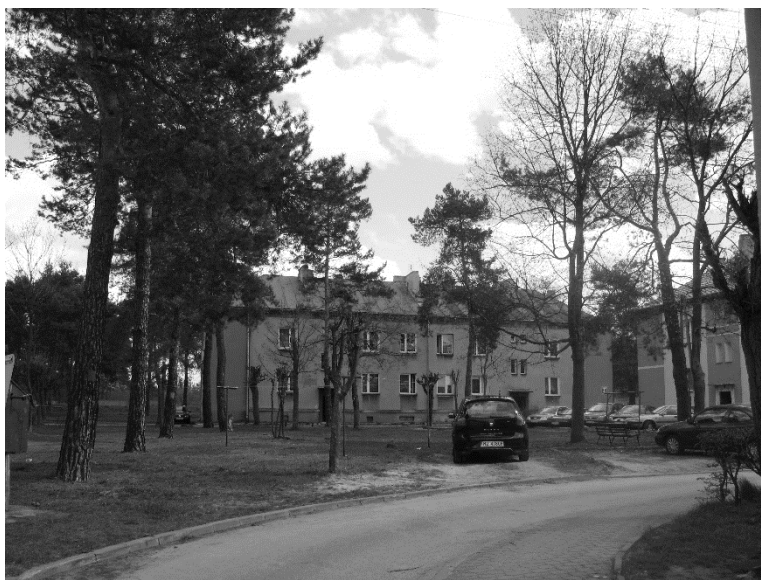
Ryc. 3. Osiedle Plac Wolności