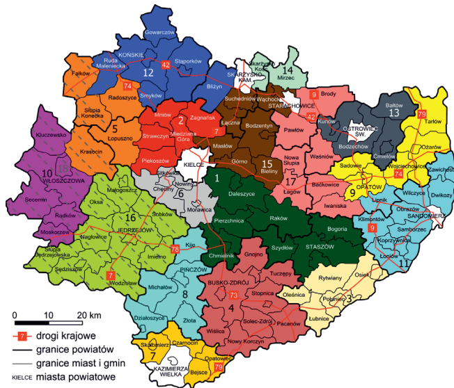
Ryc. 1. Rozmieszczenie Lokalnych Grup Działania na terenie woj. świętokrzyskiego* w 2017 roku

* Numer odzwierciedla porządek LGD zgodnie z tab. 1 i oznacza gminę lokalizacji siedziby danej grupy.