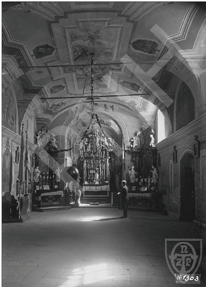
1. Węgleszyn, wnętrze kościoła parafialnego, 1905–1910

Keywords: Węgleszyn, parish church, source edition, 19 th century.