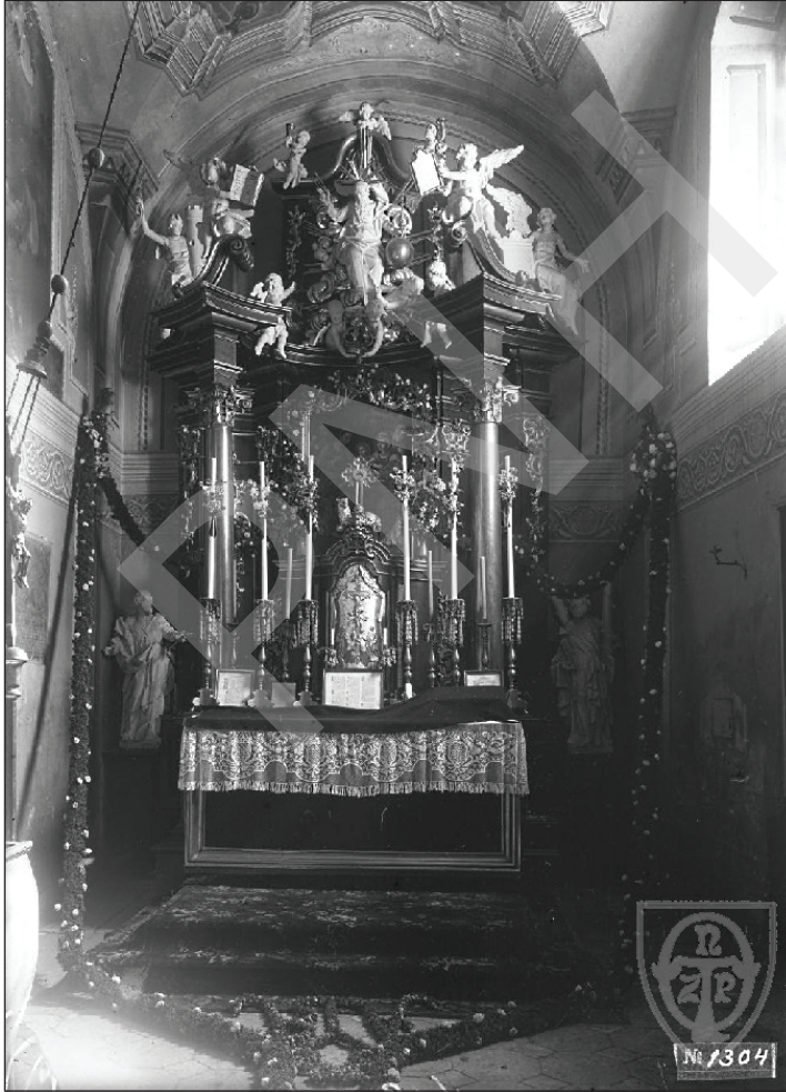
2. Węgleszyn, ołtarz główny, 1905–1910