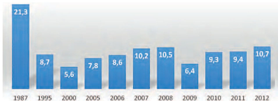
Ryc. 1. Dynamika budownictwa mieszkaniowego na Ukrainie w latach 1987–2012 (w mln m 2 )