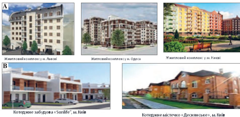
Fot. 1. Typy mieszkań na Ukrainie: a) Wieżowce na osiedlach we Lwowie, Odessie i Kijowie; b) Jednorodzinne domy mieszkalne w Kijowie