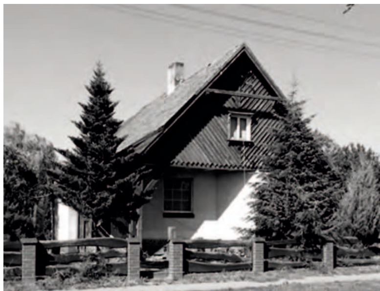
Fot. 2. Zabytkowy dom w Gołęczewie, ul. Dworcowa 36