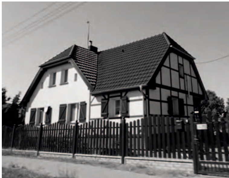
Fot. 1. Zabytkowy dom w Gołęczewie, ul. Dworcowa 30