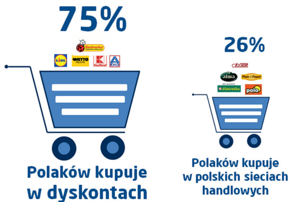
Ryc. 3. Preferencje zakupowe Polaków (2013)

robienia dużych zakupów raz w tygodniu w hipermarkecie, skoro mogą zaspokoić tą samą potrzebę szybciej i wygodniej w pobliskim dyskoncie, o którym są dodatkowo przekonani, że oferuje najniższe ceny i świeże produkty dobrej jakości. Oznacza to strategiczne zagrożenie dla handlu tradycyjnego i hipermarketów w strukturze sieci handlowej małych miast w Polsce. Przekonują o tym liczne badania (Badania PBS – 2014) wśród klientów małych miast, którzy deklarują, że robią zakupy w dyskontach, kupując coraz częściej i coraz więcej. Z badań wynika, że 75% Polaków robi zakupy w dyskontach (ryc. 3), 26% – wyłącznie w tej kategorii sklepów sieciowych. Biedronka jest niekwestionowanym liderem rankingu satysfakcji klientów sieci handlowych, przygotowanego przez PBS. Ponad 63% Polaków robi zakupy z Biedronce, z czego dla 13% to jedyne miejsce zakupów. Raport PBS „Spożywcze Sieci Handlowe w Polsce” 9 potwierdza obserwacje o zmieniającym się wizerunku i przekroju społecznym klientów sieci dyskontowych (Biedronka, Lidl, Netto, Kaufland, Aldi). Wiek, wykształcenie czy zasobność portfela kupujących w tych sklepach nie różnią się wyraźnie od klientów polskich czy zagranicznych sieci hiper- i supermarketów. Świadczy to o tym, że sklep dyskontowy przestaje być ofertą dla mniej zamożnych. Polacy polubili zakupy w sieciach dyskontowych, a wszelkie działania promocyjne, marketingowe i wizerunkowe przynoszą operatorom oczekiwane efekty rynkowe.