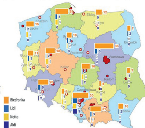
Ryc. 1. Rozmieszczenie sieci dyskontowych w Polsce według województw