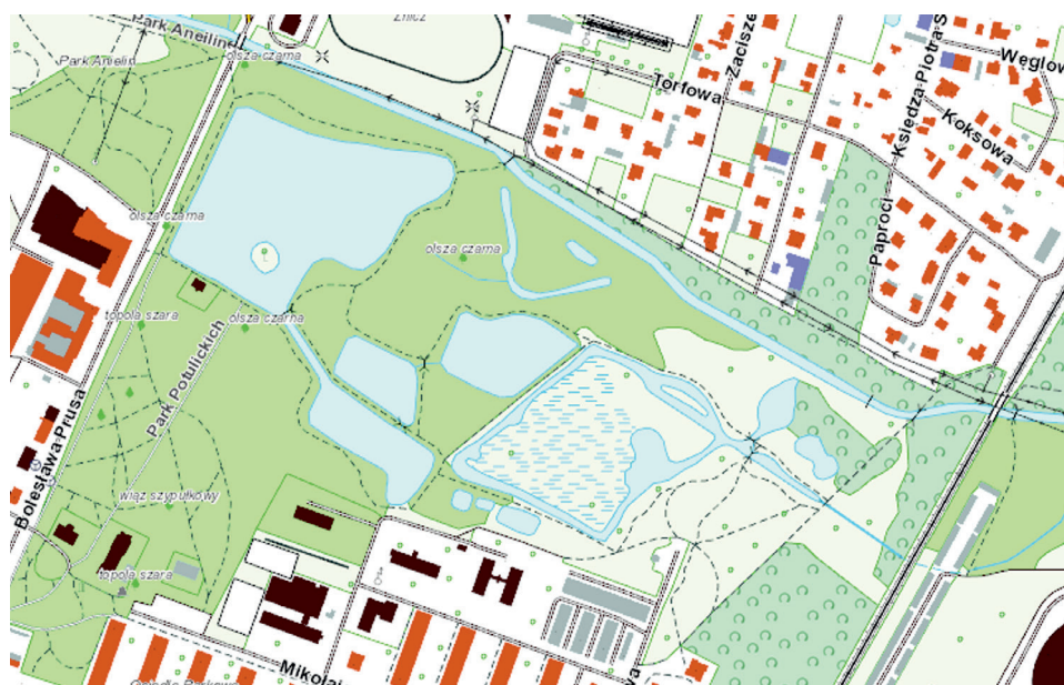
Ryc. 2. Stawy oraz zbiorniki wodne w Parku Potulickich w Pruszkowie

są liczne budki lęgowe dla ptaków oraz skrzynki dla nietoperzy, które są dla nich miejscem schronienia oraz kryjówką. Park Potulickich charakteryzuje się występowaniem unikatowych starych drzew, wśród których kilka to pomniki przyrody (Pawlat i in. 1998). Drzewa znajdujące się w parku to modrzew europejski, jesion wyniosły, wiąz szypułkowy, topola biała, topola szara, a także olsza czarna. W okolicach terenów podmokłych dominują brzozy, lipy, wiązy oraz jesiony 3 .