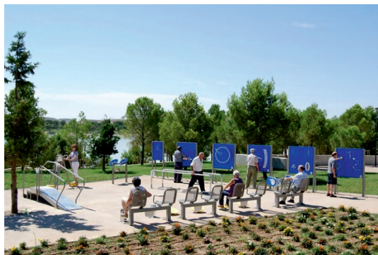
Fot. 9. Proponowana strefa seniora w projektowanym parku w Skierniewicach

Wielu mieszkańców miasta posiada zwierzęta domowe. W związku z tym w parku przewidziano miejsce dla zwierząt, które mogłyby odwiedzać je razem z właścicielami. Specjalna strefa czworonogów zostanie wyposażona w tory przeszkód (równoważnie, slalomy, tunele oraz labirynty), aby zwierzęta mogły aktywnie spędzać czas (fot. 10). Poidełka sterowane czujnikiem ruchu (fot. 11) zapewnią zwierzętom stały dostęp do wody, co zwiększy ich bezpieczeństwo i wygodę w gorące dni.