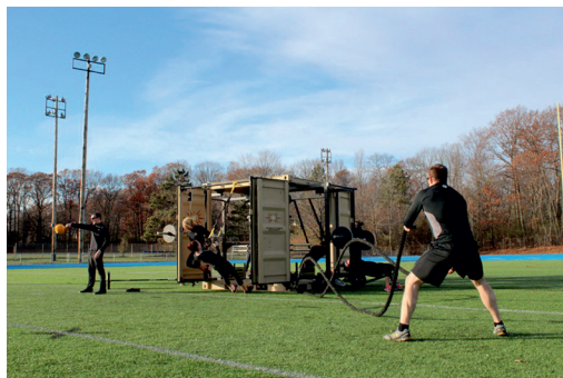
Fot. 5. Proponowana siłownia plenerowa w projektowanym parku w Skierniewicach

Najbardziej aktywni mieszkańcy miasta będą mogli skorzystać z siłowni plenerowej (fot. 5), wyposażonej w niezbędny sprzęt umożliwiający samodzielne przeprowadzenie treningu, np. CrossFit. Boiska do siatkówki (fot. 6) staną się idealnym miejscem letnich spotkań i rywalizacji sprzyjającej integrowaniu się społeczności lokalnej. Skatepark (fot. 7) przeznaczony będzie dla osób mających potrzebę połączenia sportu z odrobiną adrenaliny. Rampy, tory i przeszkody to elementy, które znajdą miejsce w skateparku. Nowoczesny sprzęt na świeżym powietrzu przyciągnie z pewnością wielu chętnych. Rozwój młodym ludziom zapewnia nie tylko zabawa, ale także gry ruchowe. Gimnastyka oraz ruch na świeżym powietrzu są w stanie zabezpieczyć młodych ludzi przed chorobami w starszych latach. Skutkami takich działań jest zachowanie nie tylko prawidłowej postawy ciała czy kondycji, ale także zręczności i koordynacji ruchowej (Dwornikiewicz 2010; Lichota 2015).