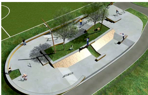
Fot. 7. Proponowany skate park w projektowanym parku w Skierniewicach