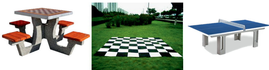
Fot. 4. Proponowane elementy do gier w projektowanym parku w Skierniewicach

Strefa gier (fot. 4) to miejsce przeznaczone dla osób, które spędzają w parku czas ze znajomymi. Można w niej będzie grać w gry, m.in. warcaby ogrodowe, gdzie to ludzie są pionkami, a także w tenisa stołowego. Rywalizacja między mieszkańcami pozytywnie wpłynie na relacje między nimi. W przyszłości będzie możliwość zorganizowania amatorskich zawodów, co zachęci użytkowników do częstego korzystania ze strefy gier w celach treningowych. Korzystanie z tej strefy będzie możliwe także dla zorganizowanych grup (klasy, firmy, rodziny), co spowoduje rozwój integracji w grupie. Połączenie gry umysłowej z umiejscowieniem jej na świeżym powietrzu będzie sprzyjało lepszemu samopoczuciu mieszkańców Skierniewic.