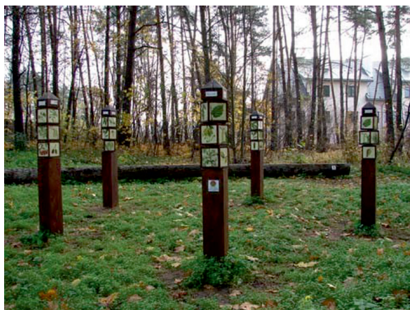
Fot. 3. Proponowana ścieżka edukacyjna w projektowanym parku w Skierniewicach

Źródło: https://app.twojbudzet.um.warszawa.pl/2017/uploads/tasks/1452866258_zalacznik_3_1362.jpg (dostęp: 09.12.2016).