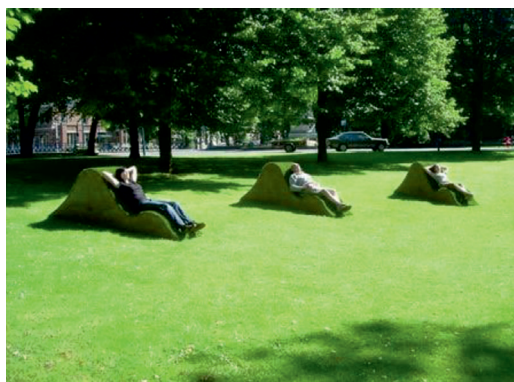
Fot. 8. Proponowane naturalne ławki w strefie relaksu w projektowanym parku w Skierniewicach

W strefie relaksu umieszczone zostaną „żywe leżaki” (fot. 8). Naturalne ławki to nowoczesna forma, łącząca miejsce odpoczynku z przyrodą. Uformowane z ziemi leżaki zostaną pokryte trawą, aby przybliżyć człowieka do natury. Zwolennicy tradycyjnych leżaków będą mogli je wypożyczyć w sklepiku przy fontannie. W strefie relaksu każdy z mieszkańców będzie mógł zaczerpnąć świeżego powietrza i odstresować się także dzięki odpowiednio dobranym roślinom. W kilku miejscach zostaną wybudowane altany, które będą miejscem spotkań, a także ewentualnego schronienia przed deszczem.