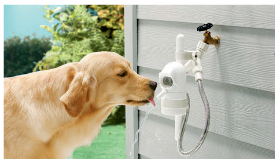
Fot. 11. Proponowane poidelka dla psów w projektowanym parku w Skierniewicach