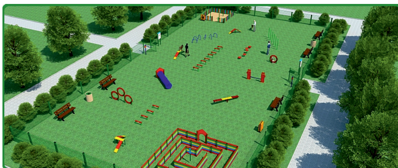
Fot. 10. Proponowany tor przeszkód dla czworonogów w projektowanym parku w Skierniewicach