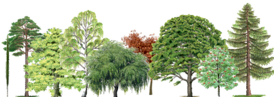
Fot. 12. Proponowane gatunki drzew i krzewów w projektowanym parku w Skierniewicach