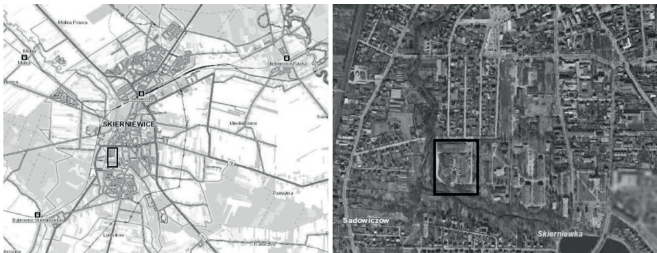
Ryc. 1. Lokalizacja firmy Stal-Car na terenie miasta Skierniewice

Analizowany obszar to teren byłych warsztatów mechanicznych, obecnie jest użytkowany przez firmę Stal-Car istniejącą od 2006 roku. Znacząca część opisywanego terenu pokryta jest płytami betonowymi i budynkami warsztatowo-magazynowymi. Jedynie na obrzeżach znajduje się roślinność, która w niewielkim stopniu podnosi atrakcyjność obszaru. Po północnej stronie analizowanego terenu znajduje się obszar zabudowań jednorodzinnych (ryc. 1). Na zachód i południe od granic opisywanej firmy przepływa rzeka Skierniewka. Po stronie wschodniej obszaru zajmowanego przez firmę Stal-Car znajduje się Państwowa Wyższa Szkoła Zawodowa w Skierniewicach.