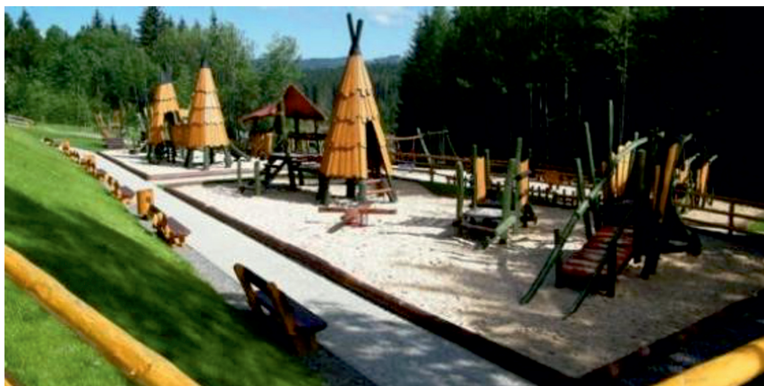
Fot. 2. Przykładowy plac zabaw do zaprojektowania w granicach proponowanego parku w Skierniewicach

Strefa dla dzieci będzie wyposażona w drewniany plac zabaw (fot. 2). Wykorzystane materiały pochodzić będą z ekologicznych źródeł, które naturalnie wkomponują się w zieleni wypełniającą park. Dzieci znajdą dla siebie miejsce idealne do zabawy. Zjeżdżalnie, piaskownica oraz inne liczne atrakcje sprawią, że dzieci chętnie będą spędzały tu czas na świeżym powietrzu, co pozytywnie wpłynie na ich zdrowie. Drewniane tipi sprawią, że miejsce to stanie się obiektem wielu przygód, a place zabaw o tematyce przygodowej są częściej odwiedzane niż tradycyjne obiekty, ponieważ stwarzają okazję do zabaw tematycznych (Kosmala 2008; Czałczyńska-Podolska 2010). Odgrywanie scenek pozwoli rozbudzić wyobraźnię dzieci, co zachęci je do ponownego skorzystania z niego.