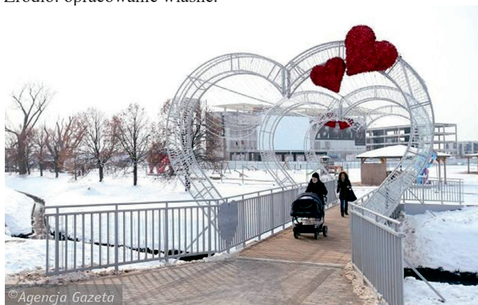
Fot. 1. Przykładowy wygląd mostku łączącego projektowany park z osiedlem po drugiej stronie rzeki Skierniewki