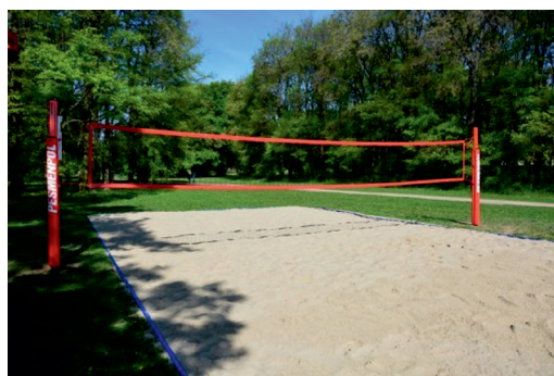
Fot. 6. Proponowane boisko do siatkówki plażowej w projektowanym parku w Skierniewicach