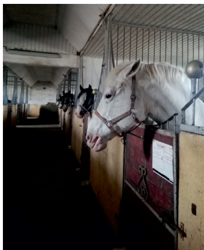
Fot. 1. Zaadaptowanie budynku obory popegeerowskiej na stadninę koni w Januszewicach