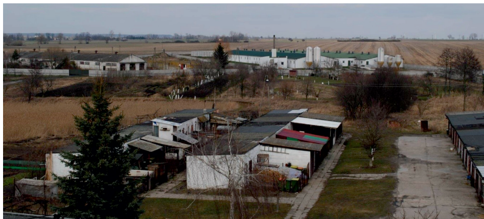
Fot. 2. Stara i nowa zabudowa gospodarcza na terenie popegeerowskim w Ligocie

Ostatni z zakładów włączonych do badania – PGR w Kobierzycku składał się z budynków gospodarczych, takich jak: stodoły, spichlerze, zbiornik małej retencji, dwie hydroformie i budynku bukaciarni. PGR w Kobierzycku to miejsce, które nie zmieniło sposobu zagospodarowania. Aktualnie na obszarze gospodarstwa prowadzi się hodowlę bydła oraz uprawę zbóż. Badania terenowe wykazały, że zasób budynków gospodarczych jest w bardzo złym stanie technicznym, wymagającym jak najszybszej modernizacji. Tereny, które w przeszłości należały do PGR-u w omawianej miejscowości, wcześniej zajmowane przez łąki i pastwiska, obecnie zajęte są przez przydomowe ogródki, w których mieszczą się szklarnie. Na potrzeby tego gospodarstwa stworzono 64 mieszkania. Obiekty te prezentują bardzo dobry stan estetyczno-architektoniczny. Jest to także przykład zaradności mieszkańców i wykorzystania przez nich funduszy unijnych (fot. 3).