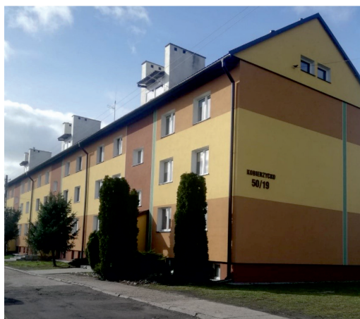
Fot. 3. Zmodernizowana zabudowa mieszkaniowa na osiedlu popegeerowskim w Kobierzycku

Ostatni z zakładów włączonych do badania – PGR w Kobierzycku składał się z budynków gospodarczych, takich jak: stodoły, spichlerze, zbiornik małej retencji, dwie hydroformie i budynku bukaciarni. PGR w Kobierzycku to miejsce, które nie zmieniło sposobu zagospodarowania. Aktualnie na obszarze gospodarstwa prowadzi się hodowlę bydła oraz uprawę zbóż. Badania terenowe wykazały, że zasób budynków gospodarczych jest w bardzo złym stanie technicznym, wymagającym jak najszybszej modernizacji. Tereny, które w przeszłości należały do PGR-u w omawianej miejscowości, wcześniej zajmowane przez łąki i pastwiska, obecnie zajęte są przez przydomowe ogródki, w których mieszczą się szklarnie. Na potrzeby tego gospodarstwa stworzono 64 mieszkania. Obiekty te prezentują bardzo dobry stan estetyczno-architektoniczny. Jest to także przykład zaradności mieszkańców i wykorzystania przez nich funduszy unijnych (fot. 3).