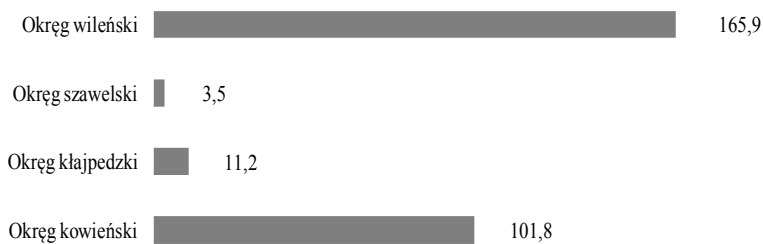
Wykres 2. Wydatki na badania i rozwój w sektorze rządowym i szkolnictwa wyższego w 2015 r. (mln euro)