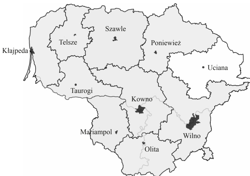
Rysunek 1. Mapa okręgów Litwy