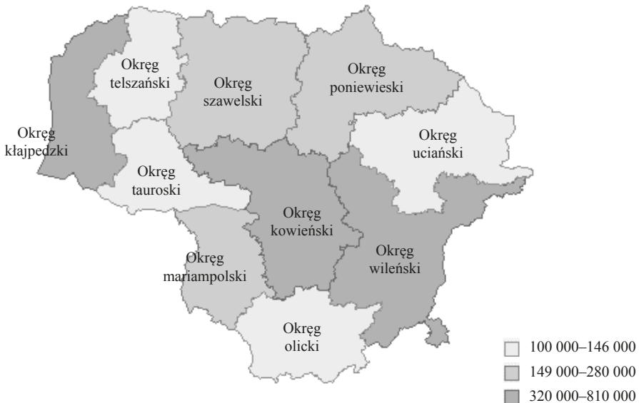
Rysunek 2. Regionalne zróżnicowanie ludności Litwy pod koniec 2015 roku