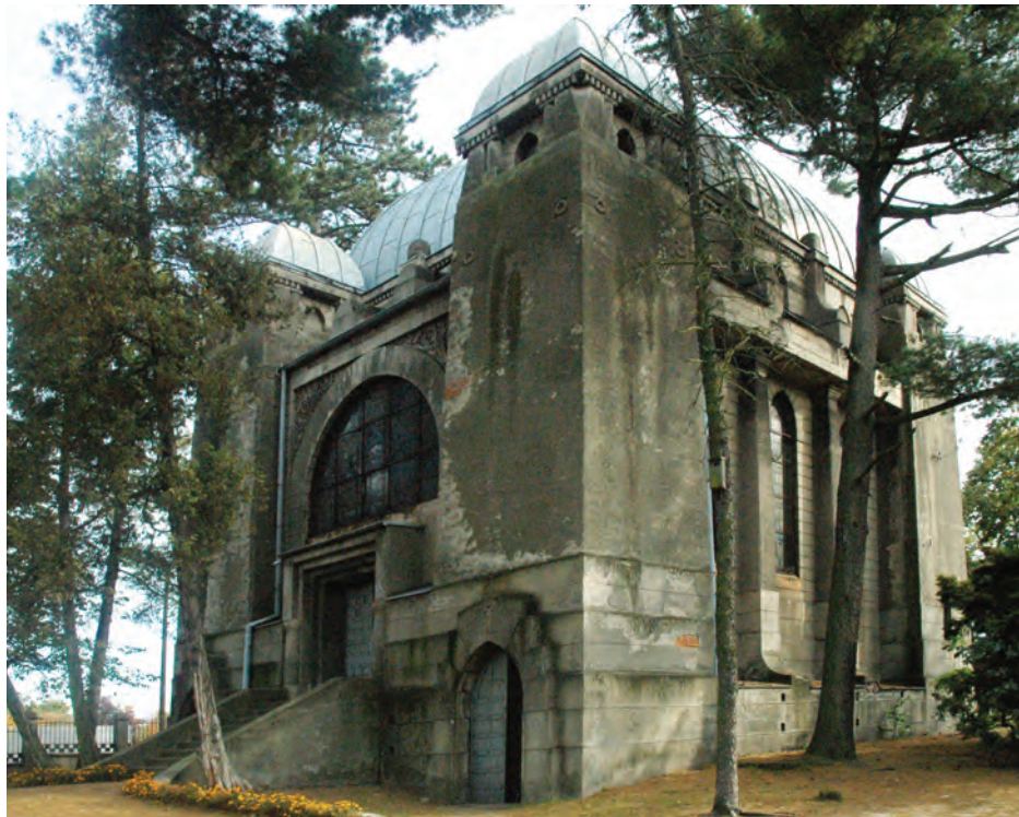
13. Cmentarz Ewangelicko-Augsburski w Pabianicach. Kaplica grobowa-mauzoleum rodziny Kindlerów, stan przed renowacją.