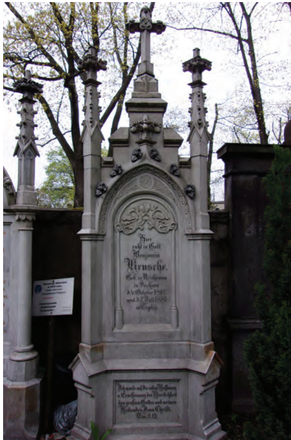
7. Cmentarz Ewangelicko-Augsburski w Pabianicach. Nagrobek Beniamina Krusche.

tworzą rodzaj przyczółków. Z kolei nagrobek rodziny Stenzel to cippus z ozdobnymi akroteriami w kształcie palmety na rogach. Na tablicy epitafijnej w ostrołukowej ramce znajduje się cytat: Jesus spricht: ich bin die Auferstehung und das Leben. Wer an mich glaubt, der wird leben ob er gleich stürbe. Ev. Joh. 11. 25 21 .