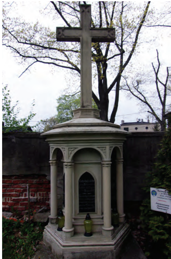
8. Cmentarz Ewangelicko-Augsburski w Pabianicach Nagrobek członków rodziny Krusche.

należą stylistycznie do nurtu sztuki klasycystycznej 26 . Obelisk stojący w kwaterze rodziny Krusche ma zatarte już epitafium, niepozwalające na dokładniejszą identyfikację zmarłej osoby. Ma prostą formę o czworokątnym przekroju, urozmaiconą podziałem na kondygnacje, a jego podstawa zakończona jest zgeometryzowaną, surową dekoracją. Z kolei obelisk Augusta i Emilie Prodohl z czarnego granitu, o przysadzistych proporcjach, ustawiony jest na postumencie z piaskowca. Nad epitafium znajduje się miejsce z widocznym ubytkiem – według karty zabytku było tam zniszczone alabastrowe tondo. Na podstawie obelisku widnieje napis: Herr Gott, du bist unsere Zuflucht für und für 27 .