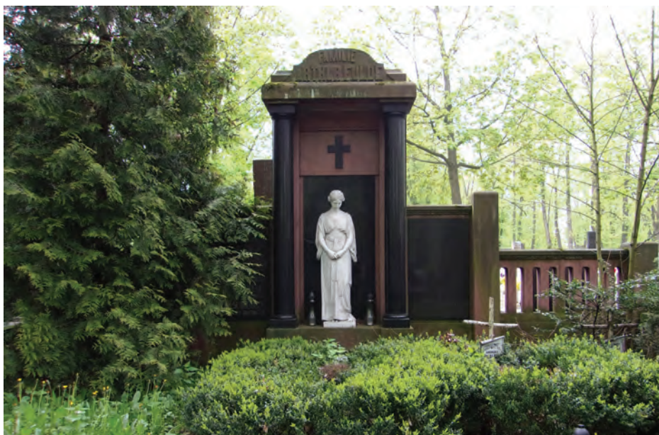
4. Cmentarz Ewangelicko-Augsburski w Pabianicach. Grobowiec Gustava rodziny Fulde.

– lekkie cofnięcie lewej nogi w kontrapoście. We wrześniu 1983 roku złodzieje za pomocą łomu oderwali posąg od cokołu. Kradzież udaremniono, a pomnik odrestaurowano 17 .