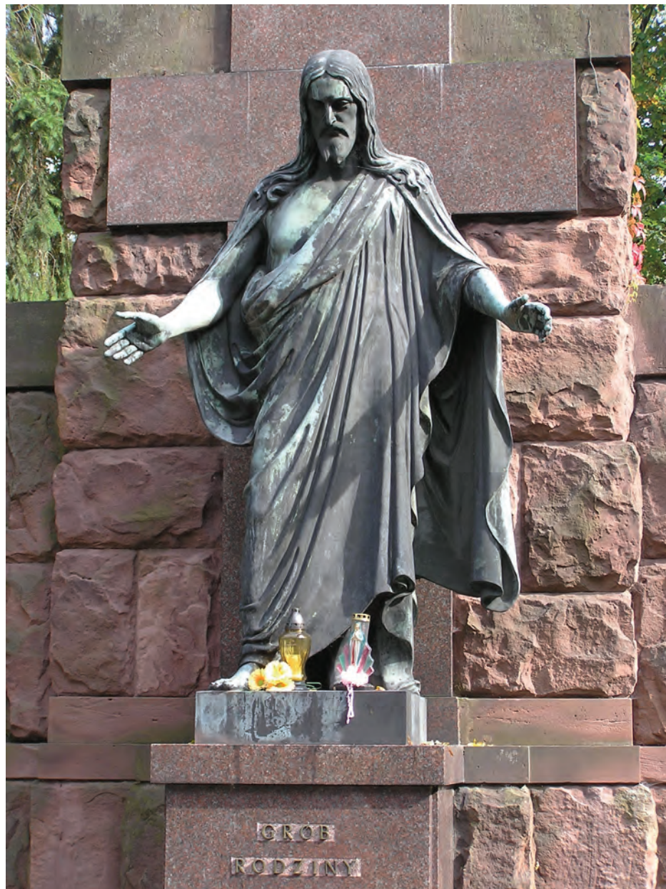
3. Cmentarz Ewangelicko-Augsburski w Pabianicach. Posąg Chrystusa Miłosiernego na grobowcu rodziny Enderów.

Dziełem zakładu Antoniego Urbanowskiego jest również grobowiec rodziny Fulde. Jego główną część stanowi aedicula zakończona półkolistym frontonem dźwiganym przez czarne kolumny. Posąg znajdujący się w płycinie przedstawia młodą kobietę z pochyloną w zadumie głową, ze splecionymi dłońmi. Sposób ukazania postaci nawiązuje do rzeźby antycznej poprzez styl szaty, uczesania i pozę