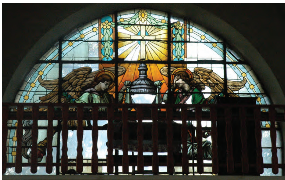
14. Cmentarz Ewangelicko-Augsburski w Pabianicach. Kaplica grobowa-mauzoleum rodziny Kindlerów – witraż we wnętrzu.