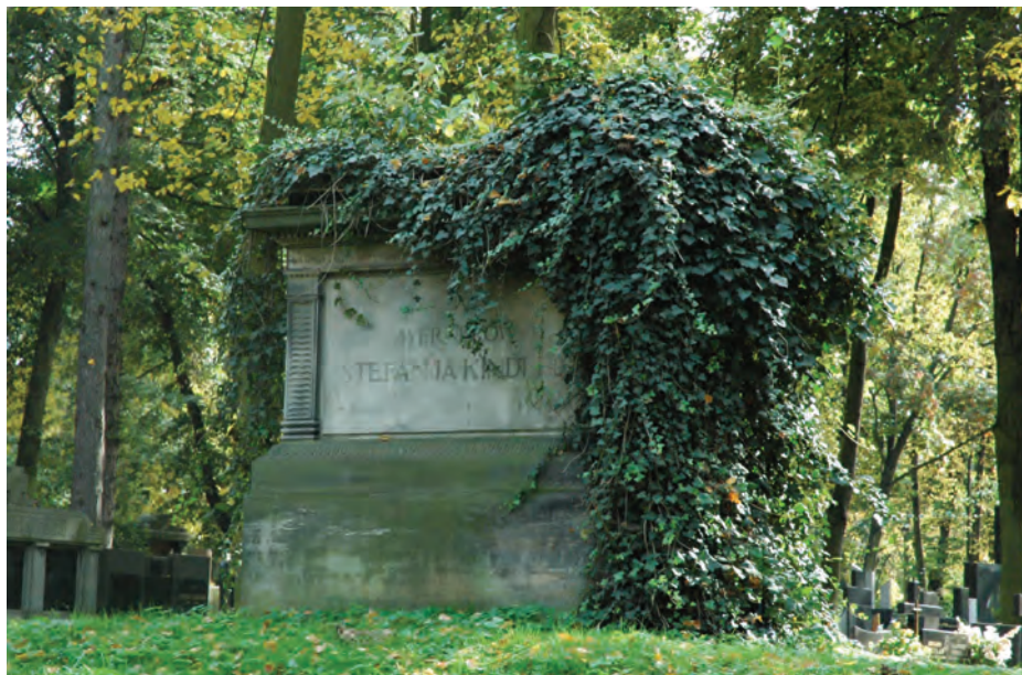
5. Cmentarz Ewangelicko-Augsburski w Pabianicach. Grobowiec rodziny Kindlerów.

aedicularnych nagrobków. Jednym z nich jest grobowiec rodziny Kruczkowskich. Jego centrum stanowi rzeźba kobiety w habicie zakonnym przypominającym strój wizytek 19 .