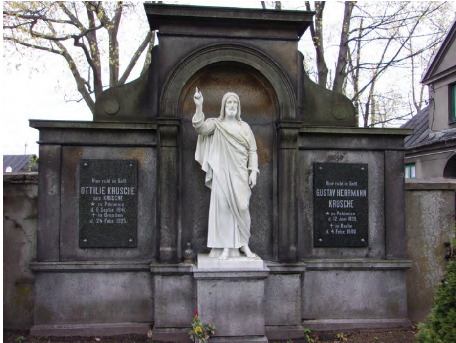
1. Cmentarz Ewangelicko-Augsburski w Pabianicach. Grobowiec Gustawa Herrmanna i Ottilii Krusche.