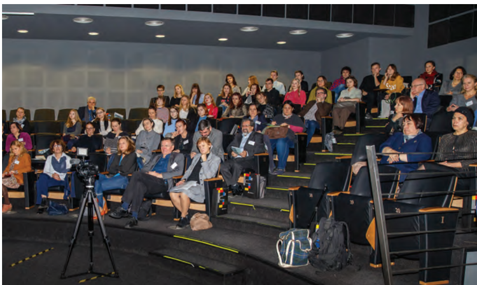
4. Uczestnicy sesji podczas obrad.