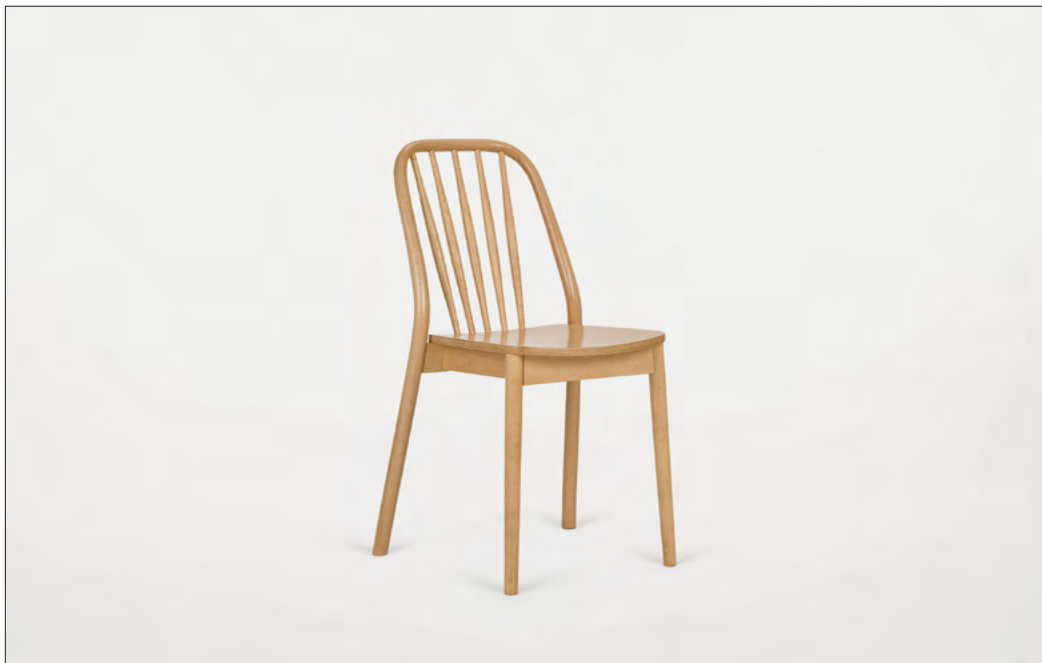
7. Krzesło ALDO proj. J. Husarskiej-Sobiny