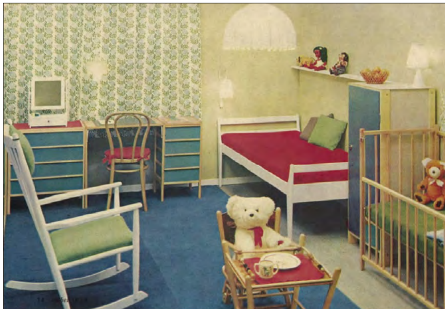
2. | Krzeselko składane BAMBINO w katalogu handlowym firmy IKEA

była wówczas znaną firmą. Jednakże negocjacje, choć były bardzo rzeczowe i szczegółowe, przebiegały w bardzo ciepłej atmosferze. Od razu pomyślałem, że chcę z nimi pracować. Pierwsze zamówienie zostało złożone już na drugi dzień po przyjeździe Ingvara do fabryki 15 . Wspomniane zamówienie złożono w Fabryce Mebli Giętych w Radomsku, a jego przedmiotem była produkcja jednego z wariantów krzeseł znanych pod nazwą Thonet 16 , które pojawiły się w produkcji fabryk będących w posiadaniu Michaela Thoneta niedługo po połowie XIX wieku i które w katalogach skandynawskiej firmy reklamowane było od 1962 roku pod nazwą Ögla . Mniej więcej od tego roku w wydawanych przez Kamprada katalogach firmowych zaczęły się pojawiać trzy modele mebli giętych produkowanych zapewne w Polsce. Obok krzeseł Ögla do oferty firmowej włączono również thonetowskie fotele bujane oraz zmodernizowane składane fotele dla dzieci, które z wersji na podwyższonych nogach przekształcały się w niski stolik z przymocowanym do niego fotelikiem. Model ten sprzedawano w Szwecji pod nazwą Bambino . Taką samą nazwę nosił on również w katalogu prezentującym produkcję mebli z czasów PRL w Jasienicy 16 .