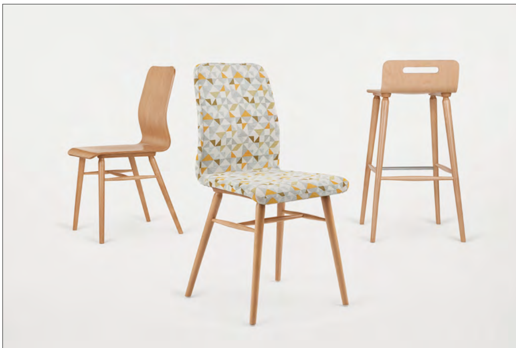
8. X-chair, proj. J. Husarskiej-Sobiny