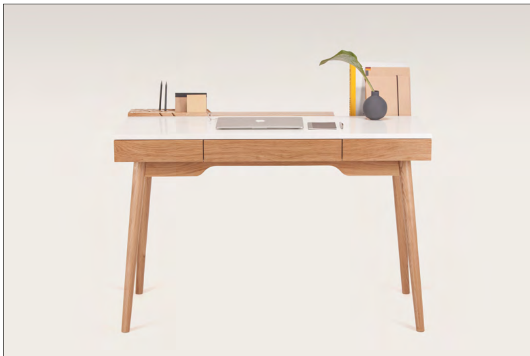
9. | Biurko OMNI proj. J. Husarskiej-Sobiny