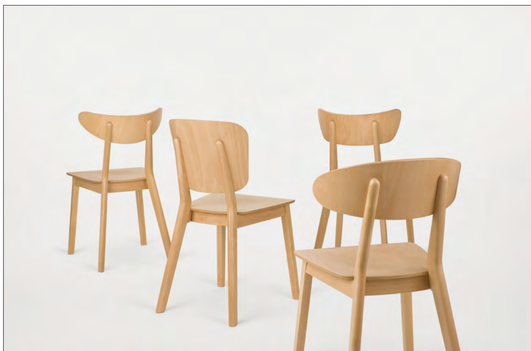
10. | Krzesło LOF proj. T. Rygalika