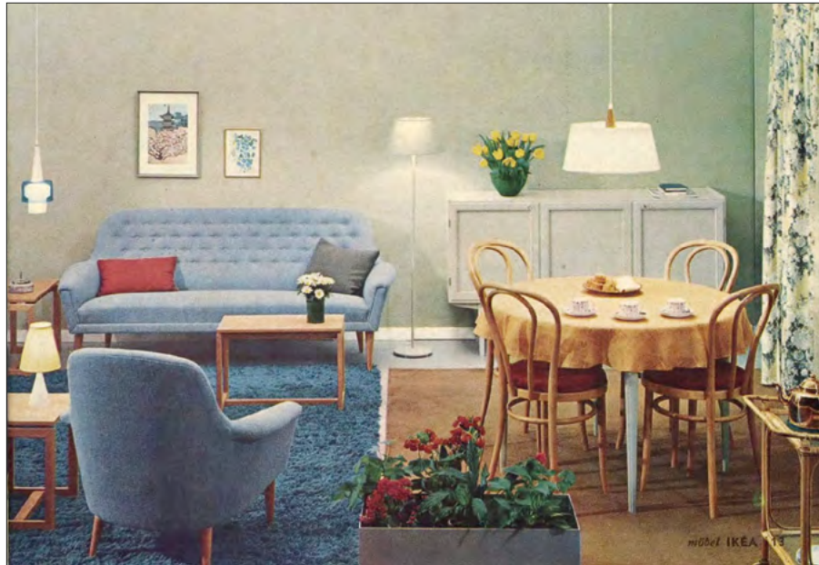
1. | Krzesła typu Thonet 16 w katalogu handlowym firmy IKEA

zaprojektowany w 1942 roku przez szwedzkiego projektanta Carla Malmstena 12 . Jego liczne warianty prezentowano w katalogach IKEA już od lat 50. XX wieku.