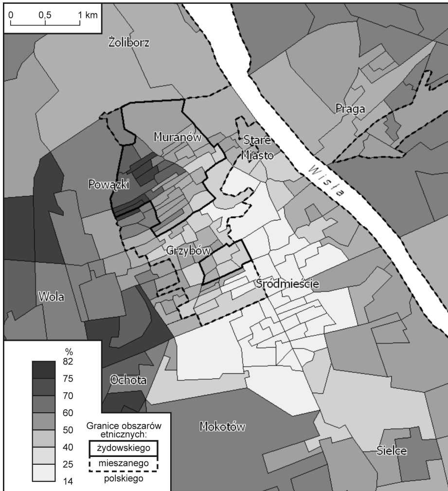
Ryc. 6. Sumaryczny wynik uzyskany przez partie lewicowe i robotnicze w obwodach wyborczych Warszawy

trolewica (głównie dzięki głosom oddanym na komunistów i PPS) uzyskała ponad 75% głosów. Ta prawidłowość dotyczy przede wszystkim dzielnic chrześcijańskich (ryc. 6).