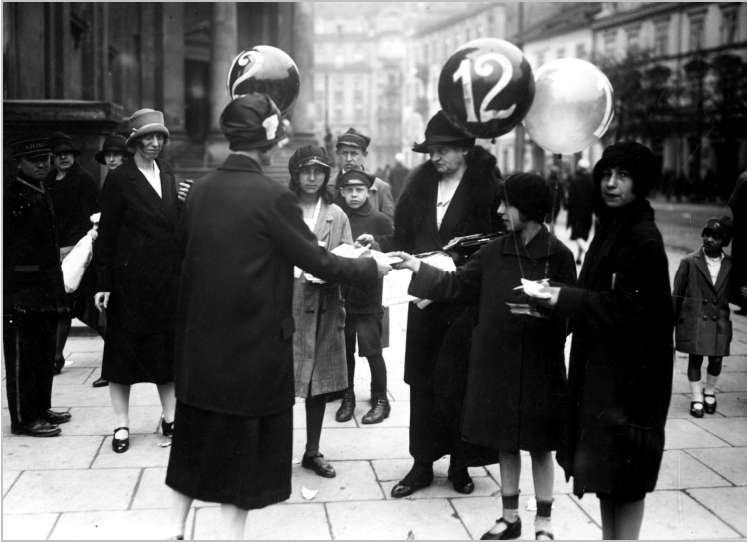
Ryc. 2. Wybory do Rady Miejskiej w Warszawie w 1927 r. Kobiety agitujące na warszawskiej ulicy w dniu wyborów na rzecz listy nr 12 – Gospodarczego Komitetu Obrony Polskości Warszawy (koalicja endecji i chadecji) Źródło: Narodowe Archiwum Cyfrowe, sygn. 1-A-3367-3