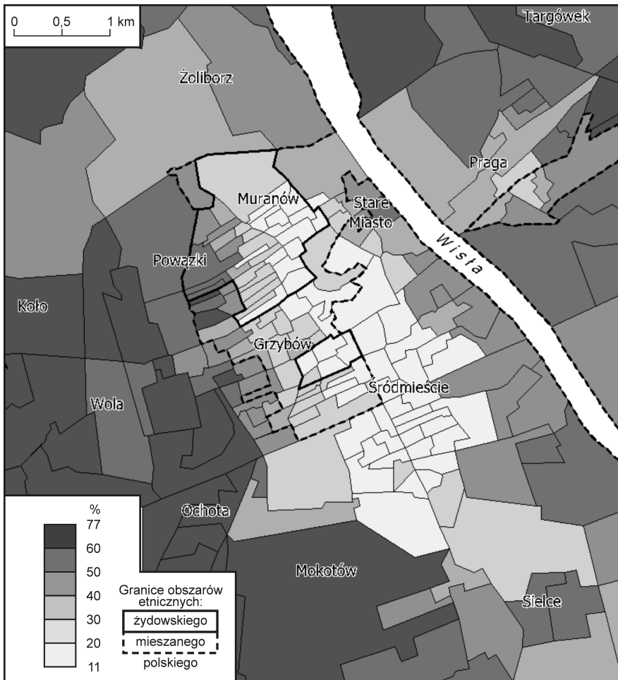
Ryc. 5. Sumaryczny wynik uzyskany przez ogólnopolskie partie lewicowe (PPS, komuniści i Niezależna Socjalistyczna Partia Pracy) w obwodach wyborczych Warszawy