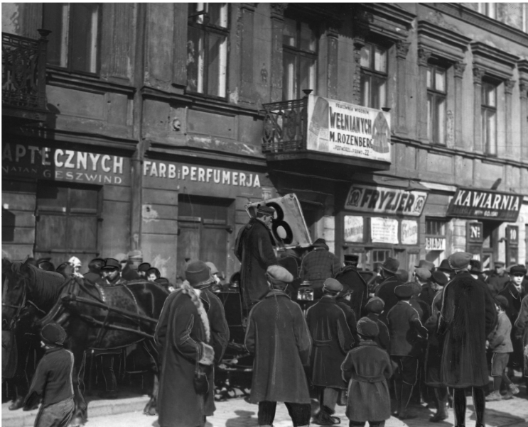
Ryc. 3. Agitacja na rzecz komitetu Żydowskich Robotników Religijnych (lista nr 18) na ul. Muranowskiej w Warszawie