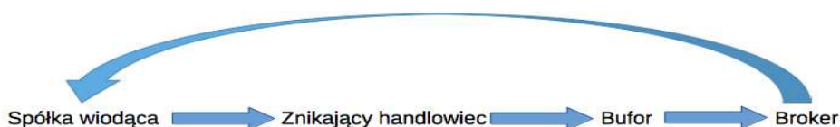
Rysunek 2. Łańcuch transakcji w przestępstwach karuzelowych