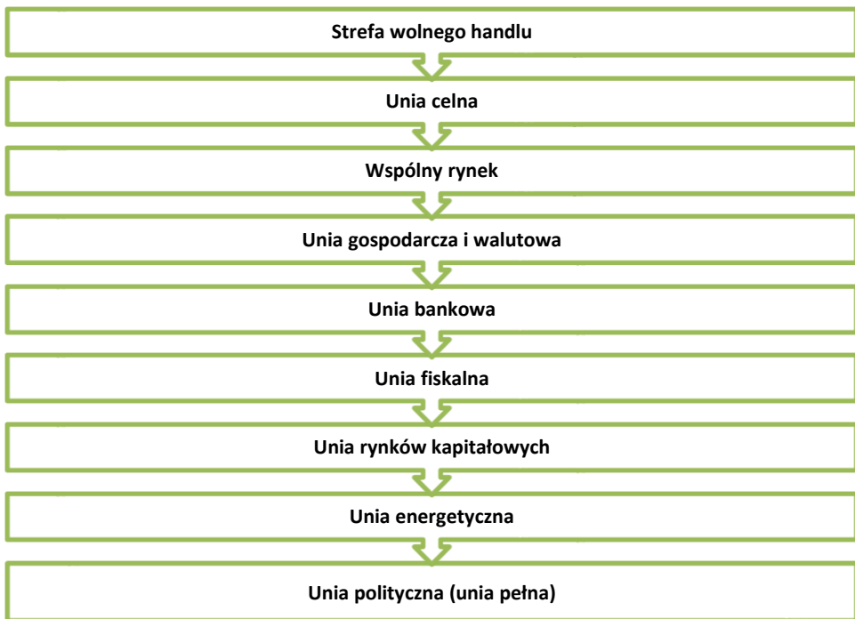
Rysunek 1. Etapy integracji europejskiej

wprowadzona zostanie wspólna waluta, a uczestnikami unii walutowej będą mogły być wyłącznie te państwa, które spełnią ustalone w traktacie warunki ekonomiczne, zwane kryteriami konwergencji. Utworzony do momentu wprowadzenia wspólnej waluty Europejski Instytut Walutowy miał wykonać prace przygotowawcze, którego funkcje z czasem miał przejąć Europejski Bank Centralny prowadzący jednolitą politykę pieniężną. Mimo, że traktat ten był wynikiem znacznego kompromisu, jednak nie wszystkie państwa członkowskie w pełni zaakceptowały jego zapisy. Przyjęciu wspólnej waluty przeciwna była Wielka Brytania oraz Dania, dlatego zwalniając je z tego obowiązku przyznano im tzw. klauzulę opt-out (Borowiec, 2011: 46–48).