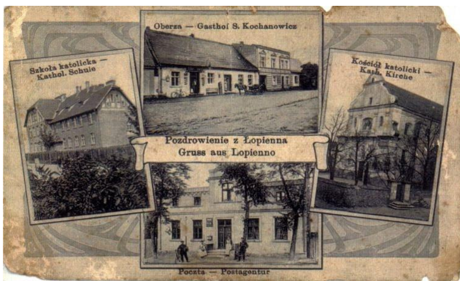
Fot. 1. Pocztcówka z Łopienna, początek XX w.; w zbiorach Szkoły Podstawowej w Łopiennie