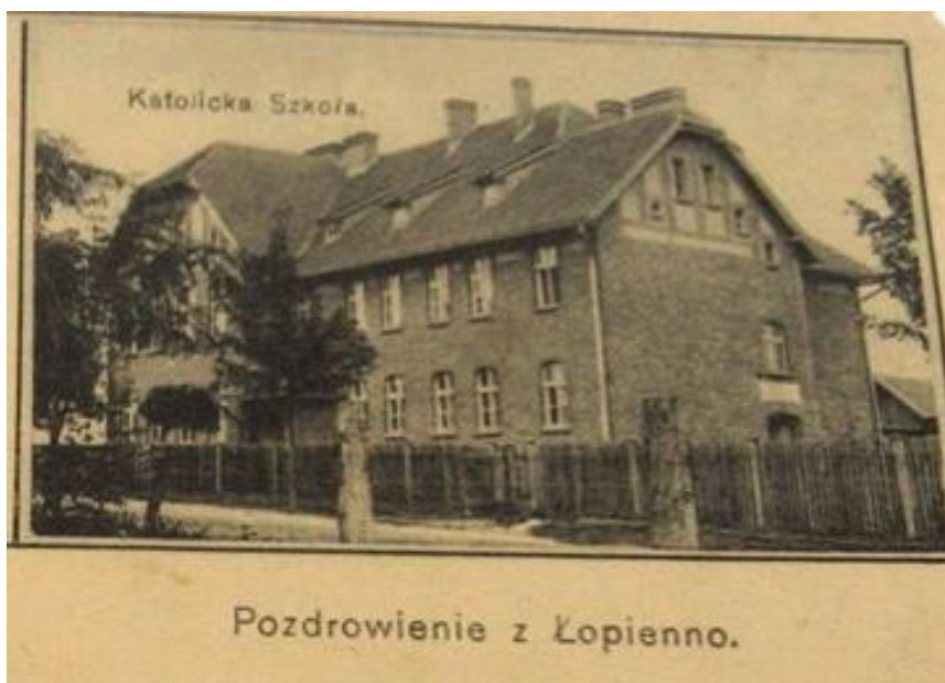
Fot. 2. Poczтівka z Łopienno (fragm.)