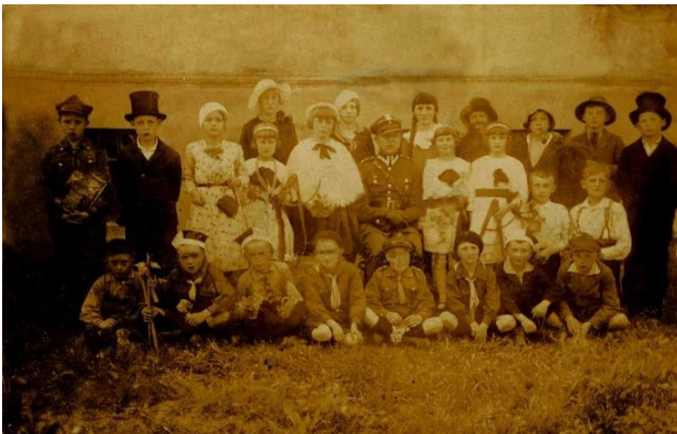
Fot. 3. „Niech się święci 3 maj” – lata 30-te XX w.

się ze śpiewu dzieci szkolnych pod batutą nauczyciela p. Priebeego z Pia-stowic, przemówienia nauczyciela p. Piątkowskiego z Gołaszewa oraz przysięgi Powstańców i Wojaków. Po odśpiewaniu Roty odbędzie się przy dźwiękach muzyki, pochód przez Łopienno do Stacji Sanitarnej, gdzie pierwsza część tej Łopieńskiej uroczystości zostanie zakończona („Gazeta Wągrowiecka” 1930a; Kronika Szkoły : 187).