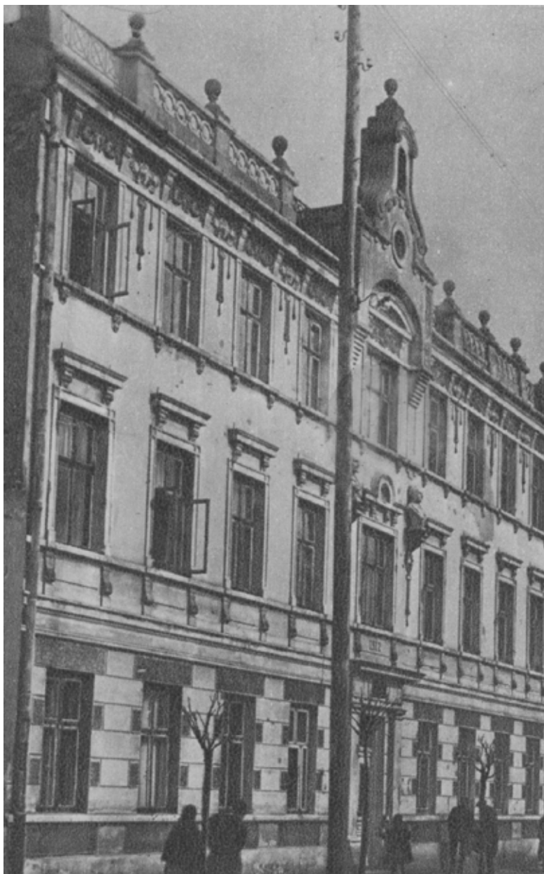
Budynek Szkoły Udziałowej Żeńskiej

Kierująca szkołą starała się o najlepszych nauczycieli. Nauka odbywała się w gabinetach przystosowanych dla potrzeb szkoły. Okupacja niemiecka w czasie I wojny światowej nie przyczyniła się do zamknięcia placówki. Przełożona